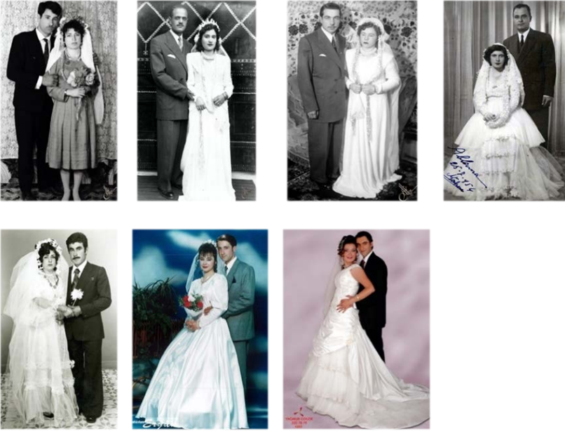
Görsel 2. Mücevher ve takı kullanımına ait temsili örnekler (1923–2010).