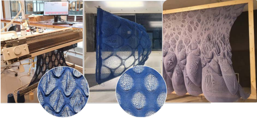
Şekil 2. Rüzgâr paneli tasarımında örme kumaş parametrik tasarım uygulaması

Parametrik tasarım ilkelerinin manuel ev tipi makine örgüsüne uygulanmayı amaçlayan örme tasarım çalışmasında, katlanabilir bir bölücü duvar için örme tekstil panellerinin tasarım sürecini ve geliştirilmesini incelemektedir. Çalışmada, tasarımda gözeneklilik ve dinamik desenler yaratmanın bir yolu olarak parametrik tasarım yöntemi kullanılmaktadır. Örme panellerin tasarım süreci, hem opak hem de şeffaf öğeleri içeren karmaşık desenlere yönelik kavramsal fikirler üretmek amacıyla Rhino3D'de Grasshopper kullanılarak yürütülmüştür (Melnyk, 2025). Görüldüğü üzere örme yüzey tasarımları parametrik tasarım yaklaşımının uygulanmasında oldukça fazla tercih edilen tekstil malzemeleridir. Hörteborn ve arkadaşları da rüzgâr paneli tasarımında örme yüzeylerin parametrik tasarım uygulamalarını denemişler ve tekstil yüzeylerin sadece tekstil ve moda alanında değil mimarî projelerde tasarım ögesi olarak kullanılabilceği ve parametrik tasarım yaklaşımının bir nesnesi konumunda olduğunu açıkça göstermişlerdir (Hörteborn, Zboinska, Chernoray ve Ander, 2022).