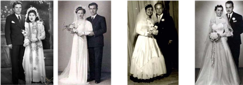
Görsel 3. El çiçeği kullanımına ait temsili örnekler (1923–2010).

Konya'ya ait düğün fotoğraflarında yer alan el çiçeği örnekleri, 1920'li yıllardan 2000'li yıllara kadar uzanan süreçte belirgin değişimler göstermektedir. Erken Cumhuriyet dönemine ait örneklerde genellikle küçük boyutlu ve sade yapay çiçek demetlerinin tercih edildiği görülmektedir. Minimal süslemelerle hazırlanan bu buketler, dönemin ölçülü ve sade estetik anlayışını yansıtmaktadır. Aynı zamanda buketlerin gelinlik ve diğer aksesuarlarla dengeli bir görsel bütünlük oluşturacak biçimde düzenlendiği dikkat çekmektedir.