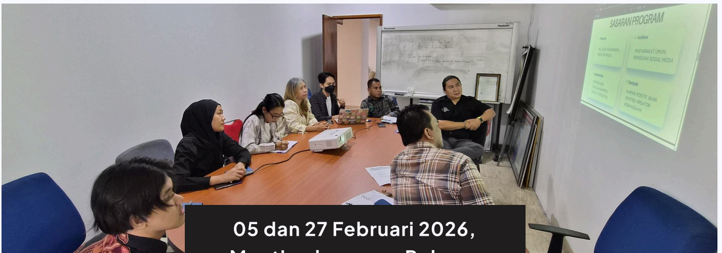
05 dan 27 Februari 2026, Meeting bersama Polpum Kemendagri

Pada 18 Februari 2026 kamu mengunjungi Museum dan Cagar Budaya, Badan Layanan Umum di bawah Kementerian Kebudayaan. Dengan Agenda audiensinya membahas kolaborasi berbagai kegiatan edukatif Beneran Indonesia di unit museum di bawah pengelolaan MCB.