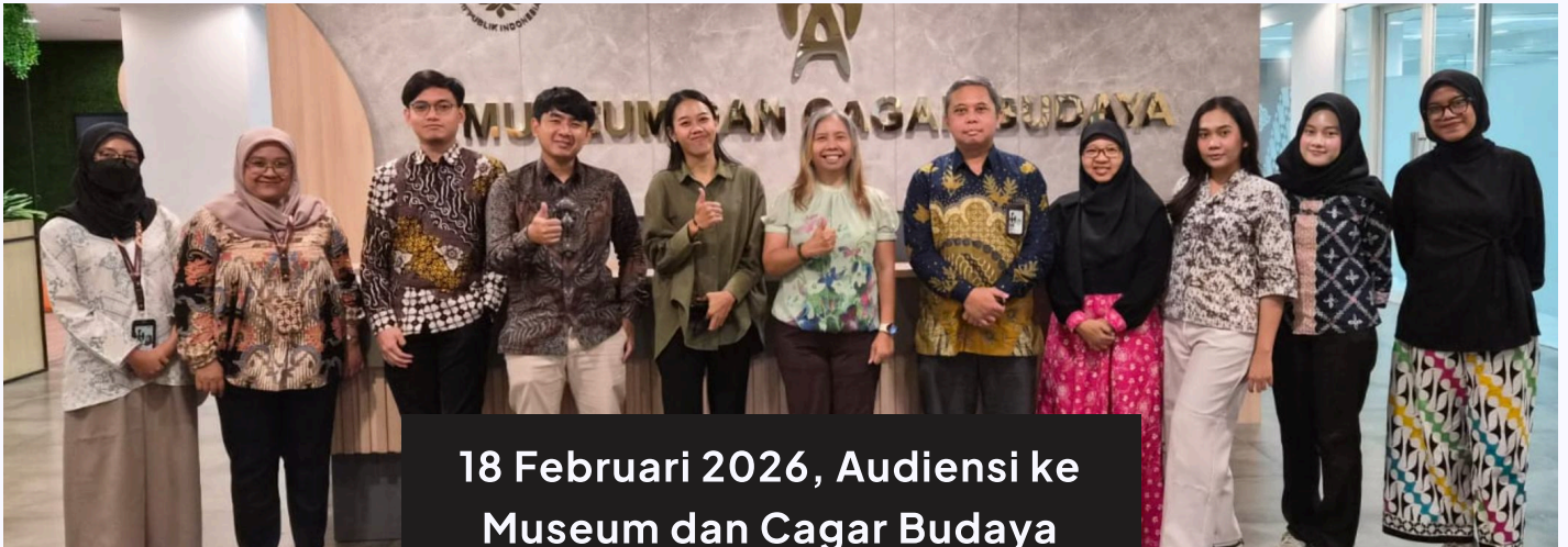
18 Februari 2026, Audiensi ke Museum dan Cagar Budaya (MCB)

Pada 18 Februari 2026 kamu mengunjungi Museum dan Cagar Budaya, Badan Layanan Umum di bawah Kementerian Kebudayaan. Dengan Agenda audiensinya membahas kolaborasi berbagai kegiatan edukatif Beneran Indonesia di unit museum di bawah pengelolaan MCB.