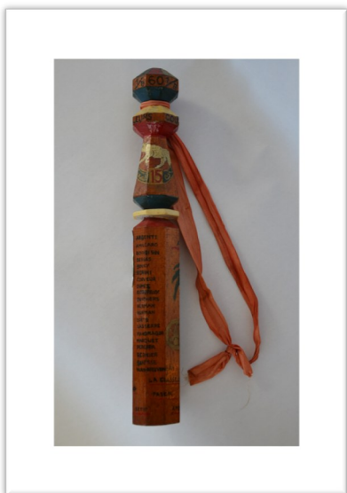
Quille avec les noms des camarades

L'expression « prendre sa quille » est restée dans le vocabulaire français, s'étendant pour désigner la fin d'une activité ou d'une tâche difficile ou encore la cessation de la période active avant le départ à la retraite. Un « quillard » est un soldat qui va bientôt terminer son service.