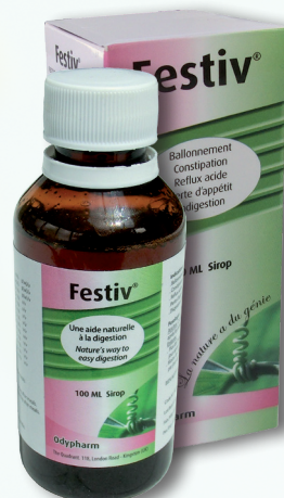
Sirup. Flacon de 30 ml

1/2 cuillère à café 2 fois/jour après le repas