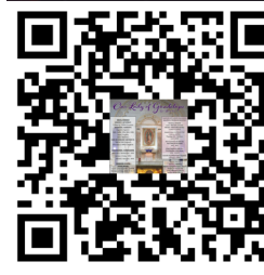
Bulletin / Boletin