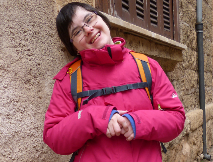
ALLE HABEN DAS RECHT IN DER MITTE DER GESELLSCHAFT ZU LEBEN.