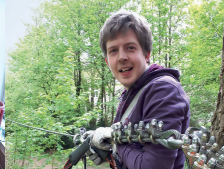
WIR FREUEN UNS AUF DAS WOHNEN IM INKLUSIVEN HAUS

Der Verein Inklusiv Wohnen Aachen e.V. realisiert ein innovatives Wohnprojekt.