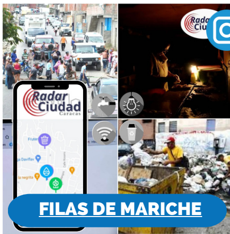
FILAS DE MARICHE