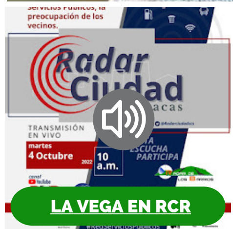
LA VEGA EN RCR