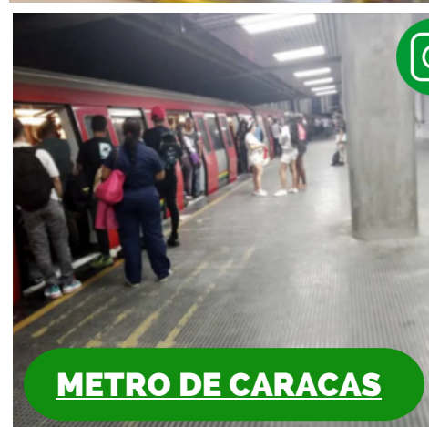
METRO DE CARACAS