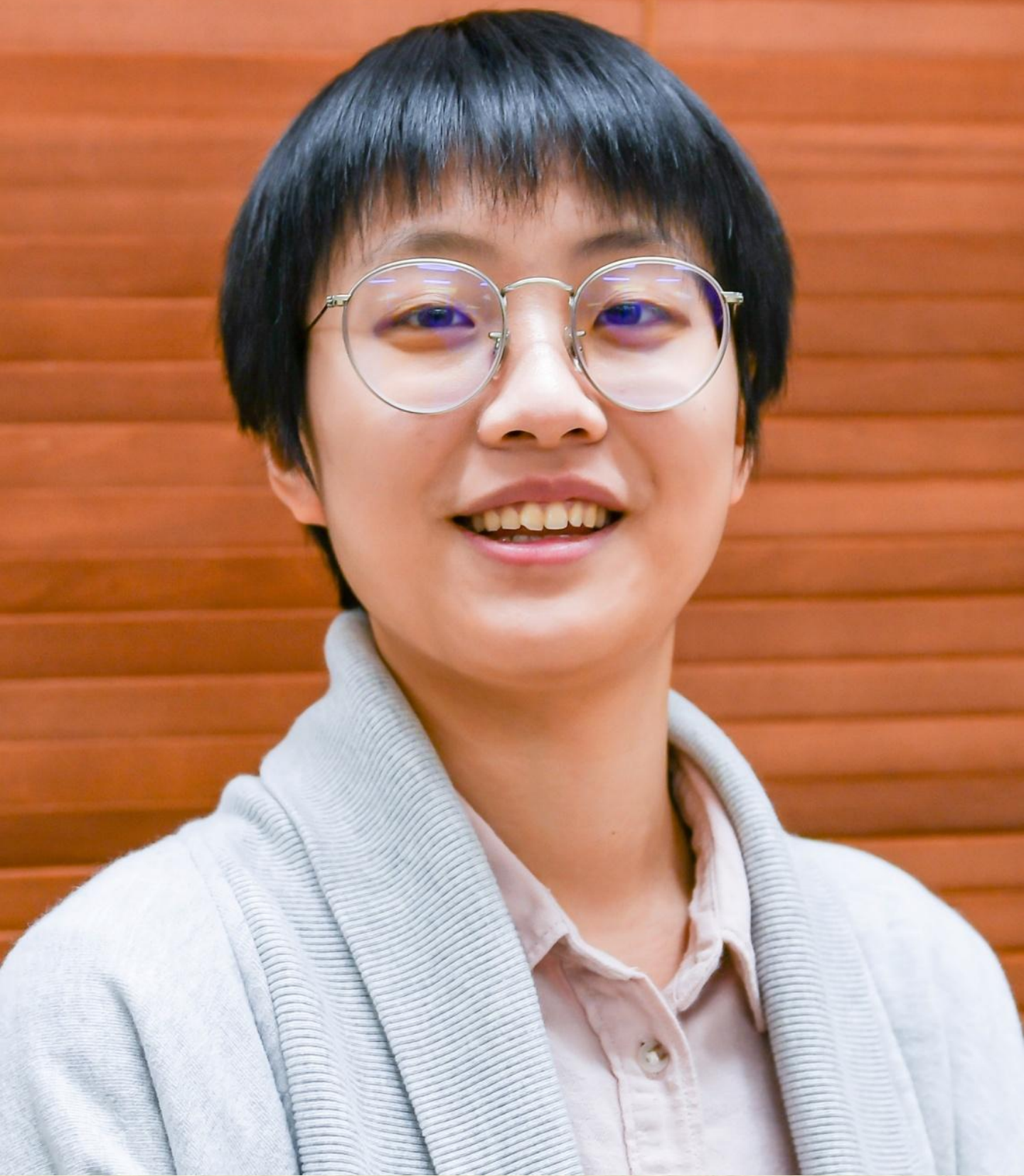
钱艳娇 (a k a Jojo) 约克大学运动队官方摄影师