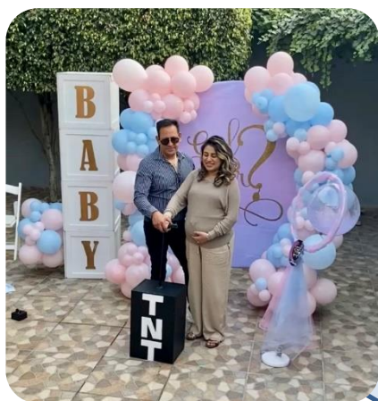
Caja TNT $599