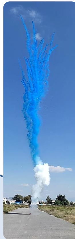
1 pirotecnia alta $1,199 Renta y montaje de equipo electrónico $1,200

* Precio variable de acuerdo al lugar del evento