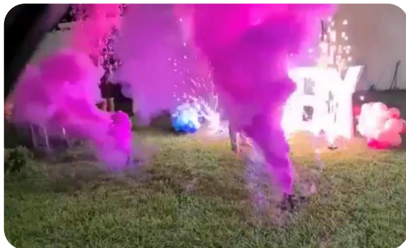
2 velas humo $599 2 pirotecnia chispas $599