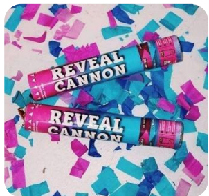
2 cañones con confetti $599

Contratando el paquete ORO de animadoras para Baby Shower o Revelación obtén $500 pesos de descuento en este combo