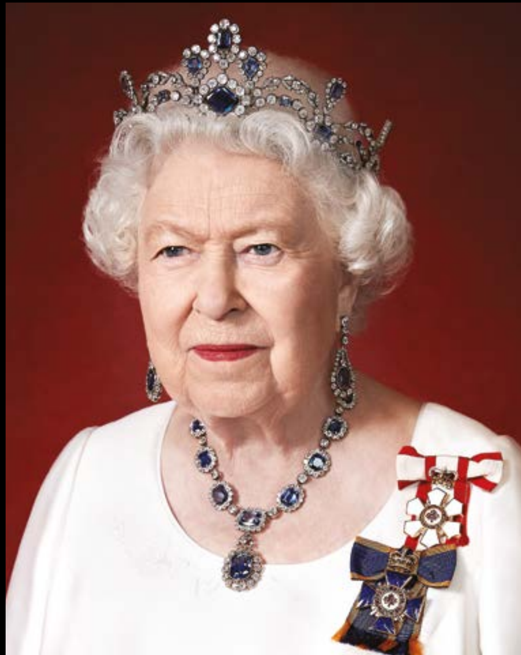
SA MAJESTÉ LA REINE ELIZABETH II HER MAJESTY QUEEN ELIZABETH II