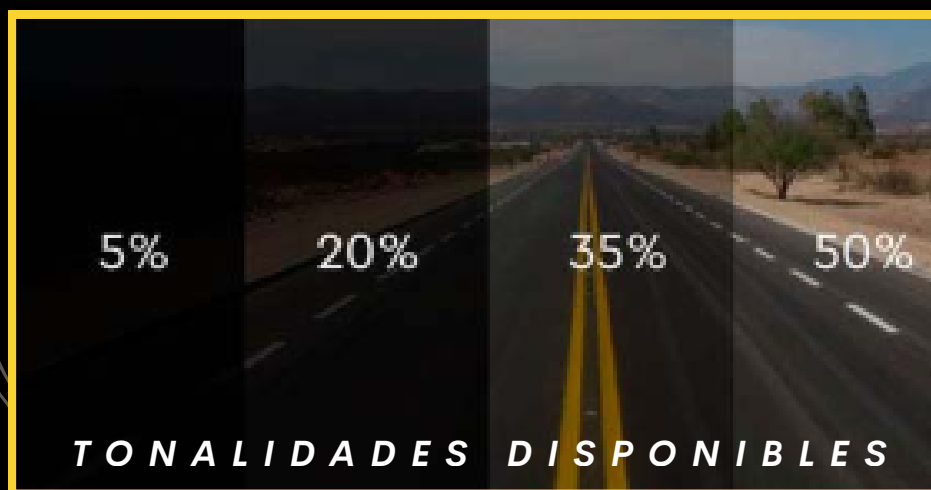
Lámina de seguridad de 4 micras, disponible en distintas tonalidades, diseñada para aumentar la protección del vidrio. Incorpora filtro UV del 99,9% y rechazo de calor del 75% (IRR) aportando protección solar. Su estructura ayuda a contener fragmentos en caso de rotura, aumentando la seguridad ante impactos y accidentes, además de mejorar la durabilidad del vidrio.