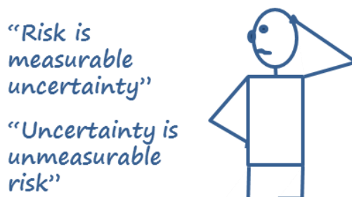
Figura 1: “El riesgo es una incertidumbre medible. La incertidumbre es un riesgo no medible”

En esta incertidumbre reside el auténtico riesgo. El empresario debe conocer que, si la amenaza del incendio llega a ocurrir, no es por culpa de la mala suerte, sino porque era una posibilidad a la que quizá no se le ha prestado la adecuada atención.