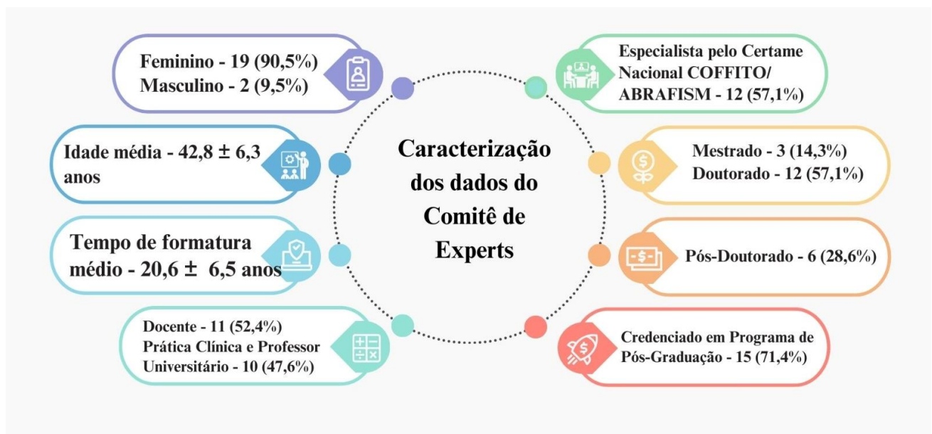
Figura 7. Características demográficas e educacionais do Comitê de experts

As características sociodemográficas e de formação/atução profissional dos 21 participantes do Comitê de Experts estão apresentadas na Figura 7.