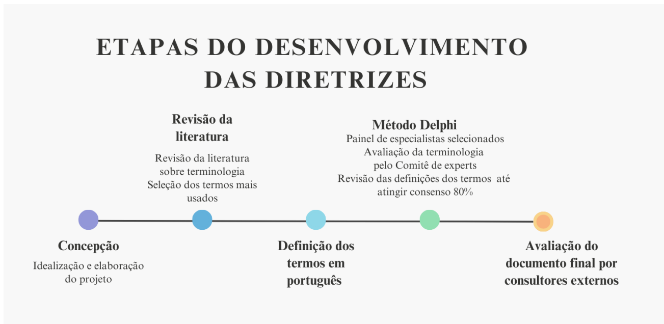
Figura 3. Etapas do desenvolvimento da Diretriz de terminologia para reportar nomenclatura relacionada ao assoalho pélvico feminino em português

As etapas metodológicas estão apresentadas na Figura 1, seguida pela descrição de cada etapa. Este projeto foi aprovado pelo Comitê de Ética em Seres Humanos da Universidade Federal de São Carlos (CAAE: 37684920.2.0000.5504).