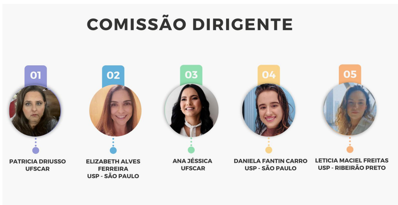
Figura 2. Membros da Comissão Dirigente da ABRAFISM de elaboração da terminologia

A Comissão Dirigente foi responsável por elaborar a revisão da literatura sobre terminologia do assoalho pélvico, propor as definições em português, convidar um grupo de experts, denominado Comitê de Especialista, para avaliar as definições dos termos e gerenciar as etapas do estudo até que fosse atingido um consenso de 80% entre o Comitê de Especialista. Todas as etapas da pesquisa foram realizadas por meio eletrônico, incluindo 35 encontros virtuais para organização do estudo e elaboração do documento final.