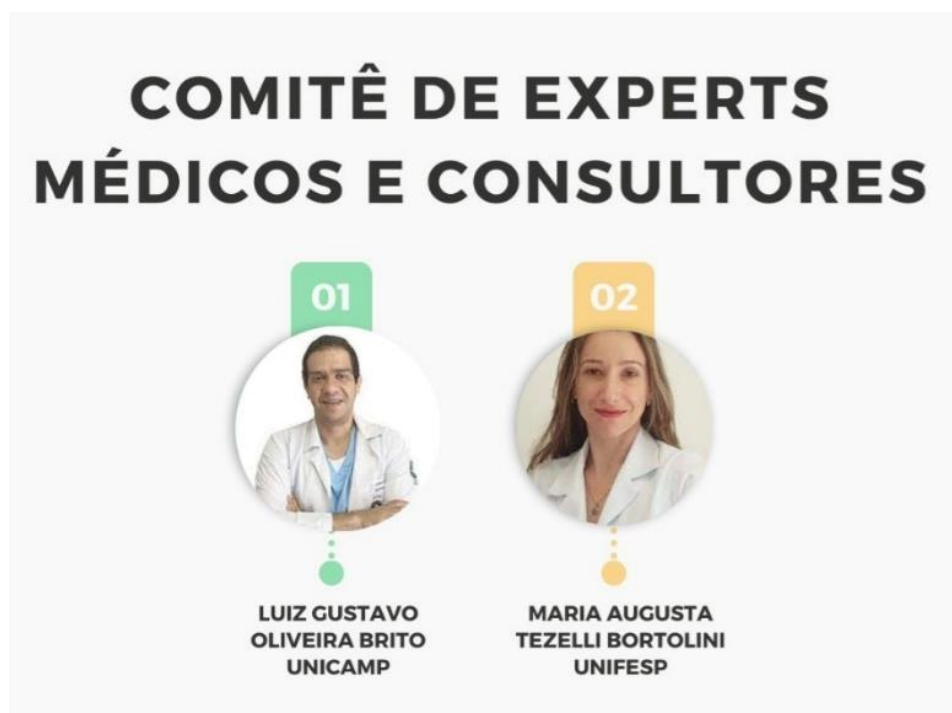
Figura 4. Comitê de Experts Médicos e Consultores

O Comitê de Experts foi constituído por 21 profissionais registrados no conselho de classe, com cinco anos ou mais de experiência no ensino ou pesquisa em Saúde da Mulher/Assoalho Pélvico, e que tinham realizado contribuição científica significativa, tais como publicação de artigo em revista científica revisada por pares relacionada ao tema ou publicado livro de alcance nacional nos cinco anos anteriores. Dos 21 profissionais, 2 eram médicos (Figura 4) e 19 fisioterapeutas (Figura 5).