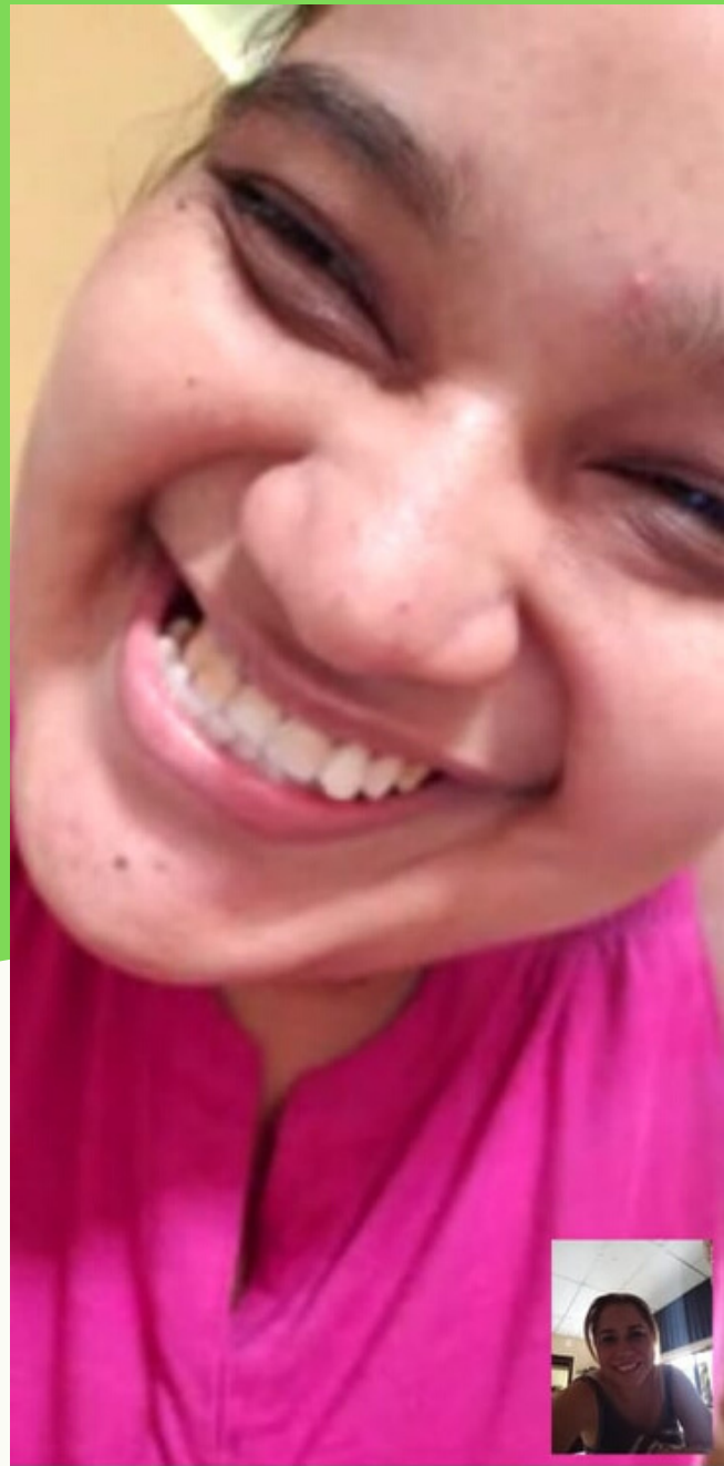
Comunicación con los estudiantes