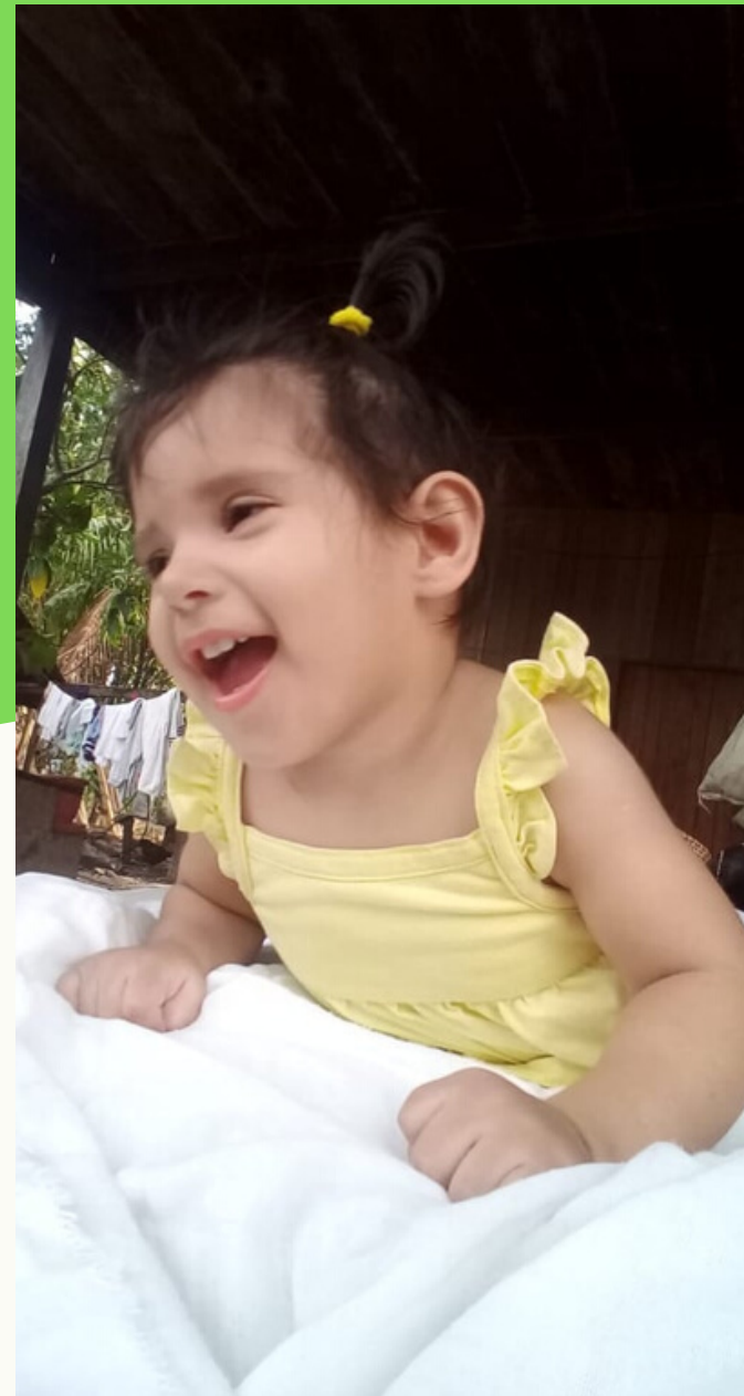
Planes de tratamiento para los padres en el hogar