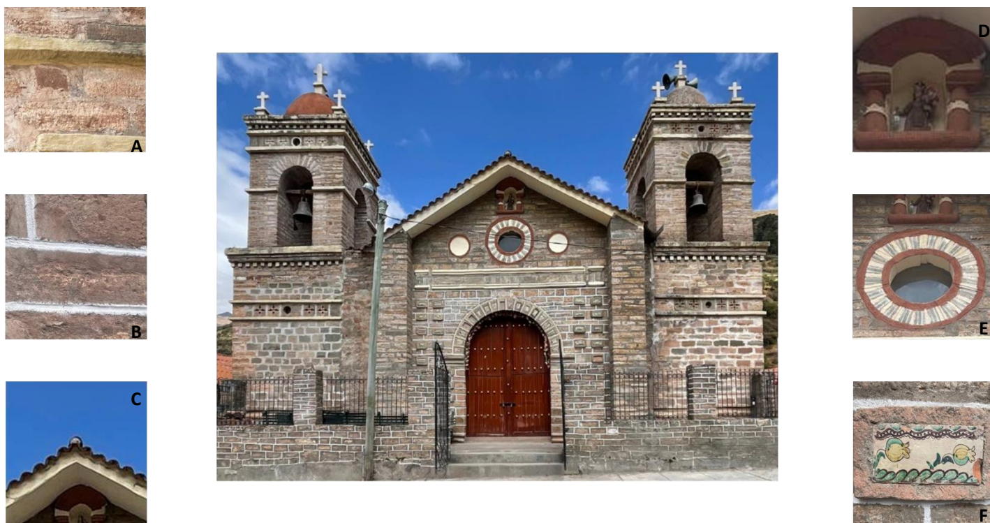
Figura 1: exterior de la iglesia Nuestra Señora del Carmen de la comunidad de Quispillaccta. A: piedra y mortero de junta original, B: intervenciones anteriores en mortero de junta, C: tejado de dos aguas, D: hornacina con la imagen de la Virgen del Carmen, E: ventana circular, F: decoración con cerámica vidriada “azulejos” en la fachada