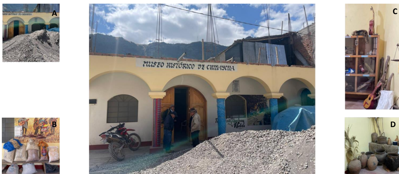
Figura 3: Museo histórico de la comunidad de Quispillaccta. A: aglomeración inadecuada de material de construcción en la fachada, B: almacenamiento de productos agrícolas en el interior del museo, C y D: almacenamiento inadecuado de los bienes de la colección del museo.