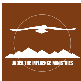
UTIM SOCIAL CHANNELS