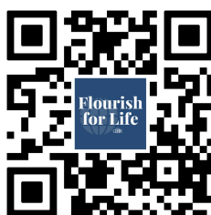
BIBLE GROWTH VIDEOS