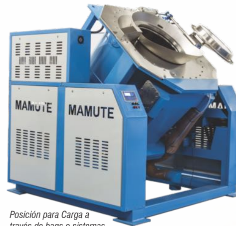
Posición para Carga a través de bags o sistemas automáticos