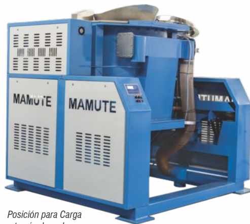
Posición para Carga a través de un banco