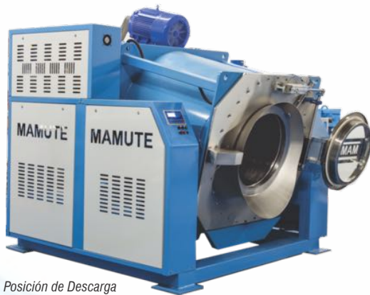
Posición de Descarga