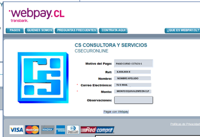
Ingreso de datos personales