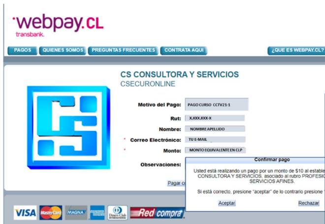
Confirmación de pago