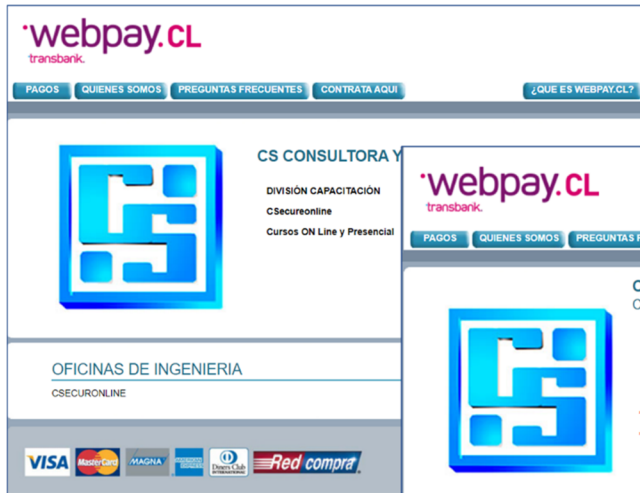
Ingreso a WEBPAY