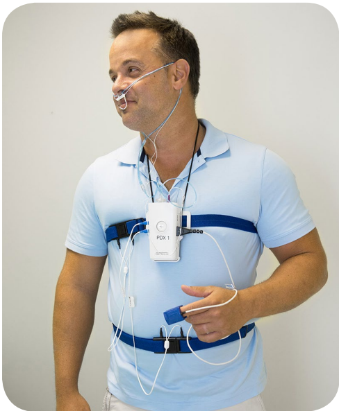
Patient muni de capteurs pour évaluer sa respiration pendant son sommeil.