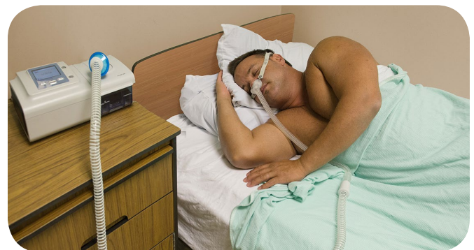
Patient dormant avec un appareil à pression positive.

Il s'agit d'un appareil qui produit une sorte de coussin d'air au niveau de la gorge pour maintenir les voies aériennes supérieures ouvertes. Ce traitement convient à la grande majorité des patients. Il existe plusieurs types d'appareil adaptés aux différentes formes d'apnée du sommeil.