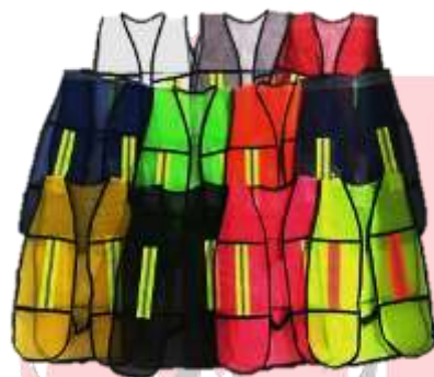
CHALECO DE MALLA