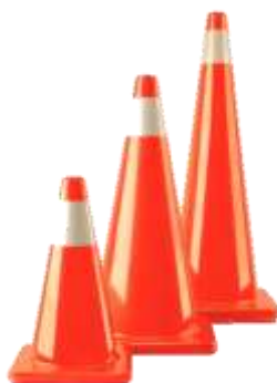
CONO CON REFLEJANTE DE 45, 71, 91 CM