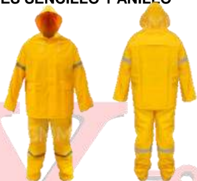
IMPERMIABLE PANTALON Y CHAMARRA AMARILLO CON REFLEJANTE