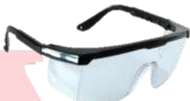
LENTE DE SEGURIDAD CUADRADO MICA OSCURA