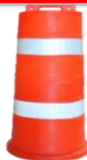
TRAFITAMBO CON REFLEJANTE