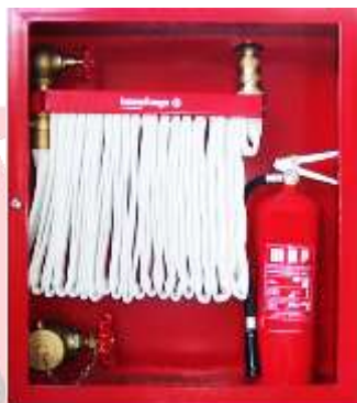
GABINETE PARA EXTINTOR Y MANGERA