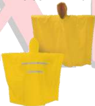
IMPERMIABLE CAPAMANGA CON REFLEJANTE