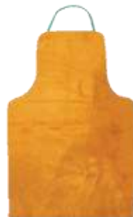
MANDIL DE CARNAZA