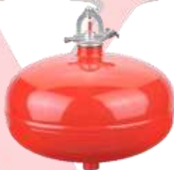
GRANADA AUTOMATICA DE POLVO QUÍMICO SECO 4.5 KG Y 6.0 KG CON Y SIN DETECTOR DE HUMO NUEVOS, RECARGAS Y MANTENIMIENTOS.