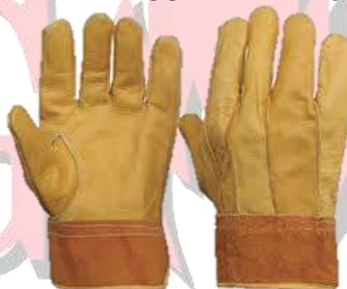
GUANTE DE PIEL DE RES ELECTRICISTA