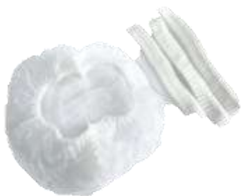
COFIA PLISADA DESECHABLE