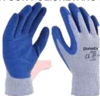
GUANTE DE ALGODÓN CON LATEX #7, #8, #9