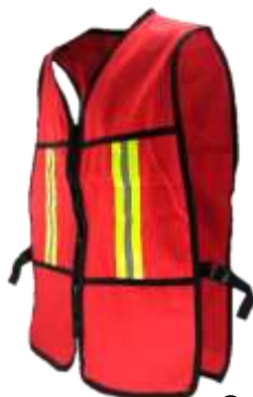
CASACA TIPO MALLA