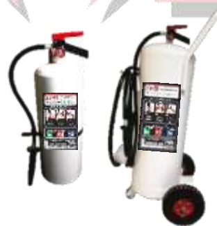
EXTINTOR MOVIL DE AGUA A PRESIÓN DE 10 L, UNIDAD MOVIL DE AGUA A PRESIÓN DE 50 L NUEVO, RECARGA Y MANTENIMIENTOS.