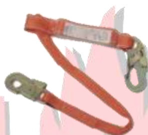
LINEA DE VIDA SENCILLA 1.80M POSTE ALINEADOR CON BASE RELLENABLE