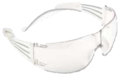
LENTE DE SEGURIDAD REDONDO MICA CLARA