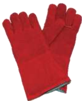
GUANTE DE SOLDADOR