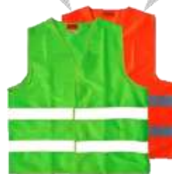
CHALECO DE MALLA