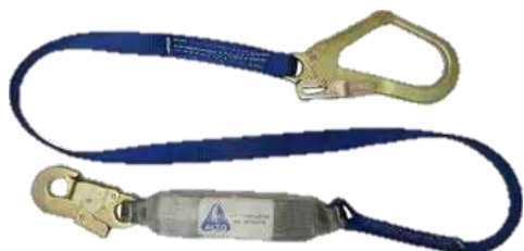
LINEA DE VIDA CON AMORTIGUADOR GANCHO GRANDE