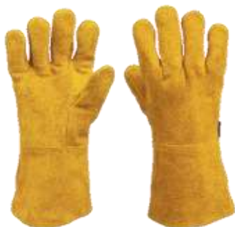
GUANTE DE CARNAZA LARGO AMARILLO