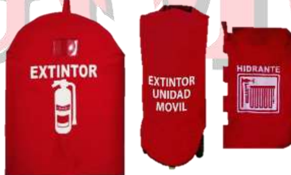
FUNDA PARA EXTINTOR PORTATIL, UNIDAD MOVIL E HIDRANTE