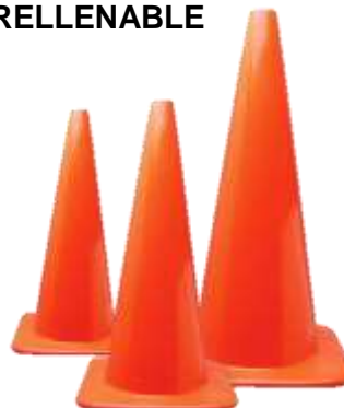
CONO SIN REFLEJANTE DE 45, 71, 91 CM