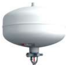
GRANADA AUTOMATICA DE AGUA A PRESIÓN SECO 4.5 KG Y 6.0 KG CON Y SIN DETECTOR DE HUMO NUEVOS, RECARGAS Y MANTENIMIENTOS.