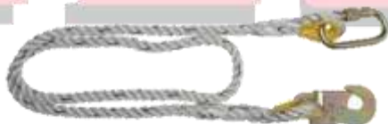
LINEA DE VIDA SENCILLA TRENZADA 1.80M