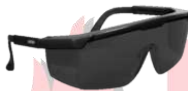
LENTE DE SEGURIDAD CUADRADO MICA OSCURA