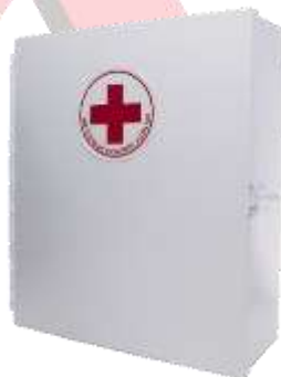
GABINETE PARA BOTIQUIN DE PRIMEROS AUXILIOS, VACIO Y LLENO