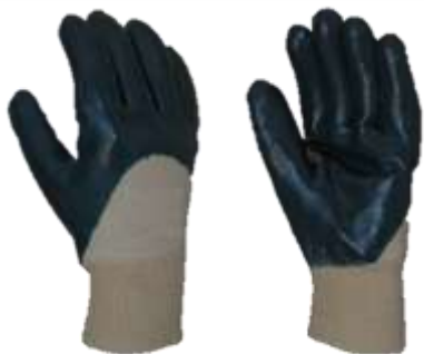
GUANTE DE ALGODÓN CON NITRILO AZUL #7, #8, #9