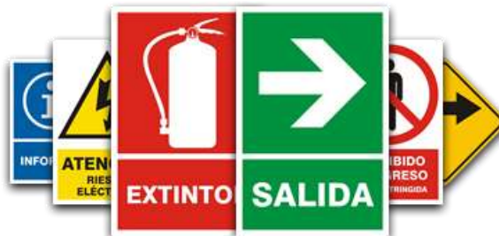
SEÑALAMIENTOS EN MATE Y FOTOLUMINISCENTE