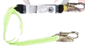
LINEA DE VIDA CON AMORTIGUADOR