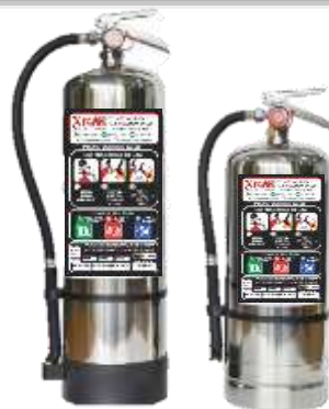
EXTINTOR DE TIPO K (PARA COCINAS) DE 2.0 KG Y 4.5 KG NUEVO, RECARGA Y MANTENIMIENTOS.