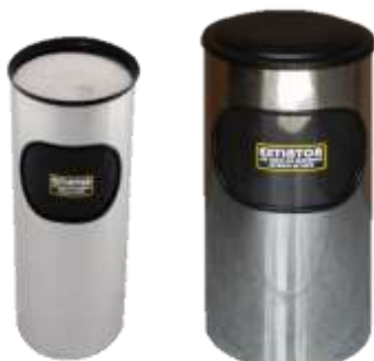
GABINETE PARA EXTINTOR TIPO CENICERO