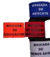
BRAZALETE PARA BRIGADAS