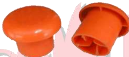
CAPUCHÓN DE SEGURIDAD