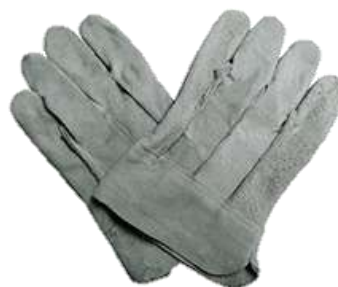
GUANTE CARNAZA CORTO ECONOMICO