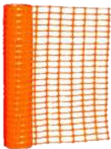
ROLLO DE MALLA PLASTICA NARANJA