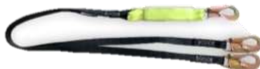
LINEA DE VIDA CON AMORTIGUADOR DOBLEBRAZO GANCHO CHICO