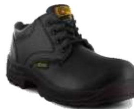
ZAPATO DE SEGURIDAD DE PIEL DIELECTRICO