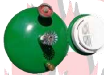
GRANADA AUTOMATICA DE AGENTE LIMPIO SECO 4.5 KG Y 6.0 KG CON Y SIN DETECTOR DE HUMO NUEVO, RECARGA Y MANTENIMIENTOS.