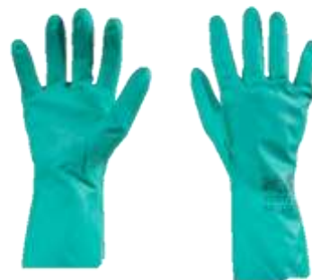
GUANTE TIPO SOLVEX MARCA JUSTEIN #7, #8, #9, #10