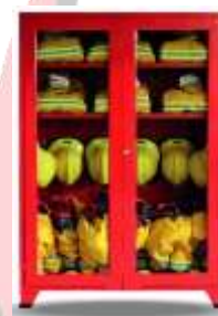
GABINETE PARA TRAJE DE BOMBERO