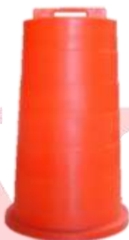
TRAFITAMBO SIN REFLEJANTE