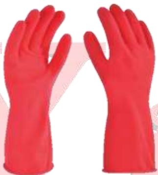
GUANTE DE LATEX PARA LIMPIEZA GENERAL #7, #8, #9