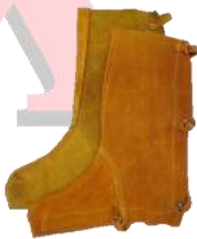
POLAINAS DE CARNAZA