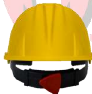
CASCO DE SEGURIDAD CON MATRACA