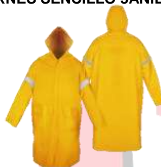
IMPERMIABLE GABARDINA CON REFLEJANTE