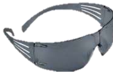
LENTE DE SEGURIDAD REDONDO MICA OSCURA