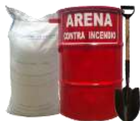
BOTE ARENERO CON/SIN PALA, CON/SIN ARENA