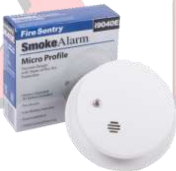
DETECTOR DE HUMO