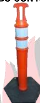
POSTE ALINEACION BASE DE NEOPRENO