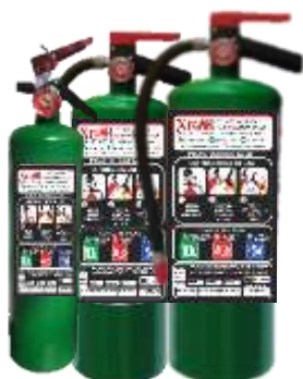
EXTINTOR PORTATIL DE AGENTE LIMPIO 2.0 KG, 4.0 KG Y 6.0 KG NUEVOS, RECARGAS Y MANTENIMIENTOS.