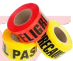
CINTA DE ACORDONAMIENTO