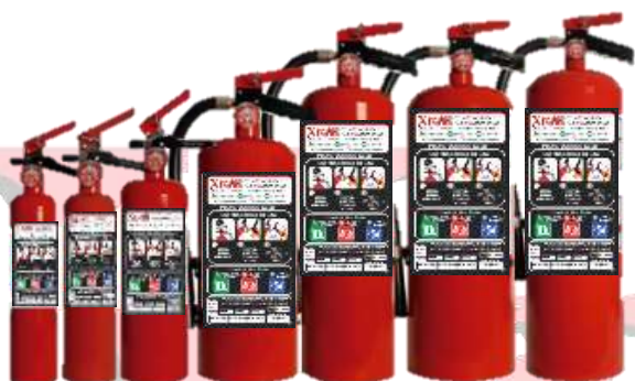
EXTINTOR PORTATIL DE POLVO QUÍMICO SECO ½ KG, 1 KG, 2 KG, 4.5 KG, 6.0 KG, 9.0 KG Y 12 KG. NUEVOS, RECARGAS Y MANTENIMIENTOS.