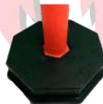
POSTE ALINEADOR CON BASE RELLENABLE