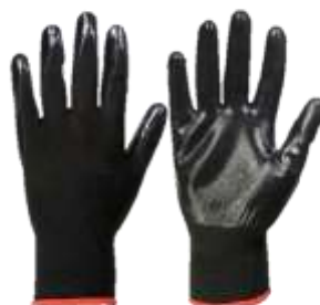
GUANTE NYLON CON NITRILO #7, #8, #9