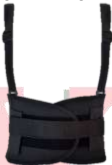
FAJA DE SEGURIDAD