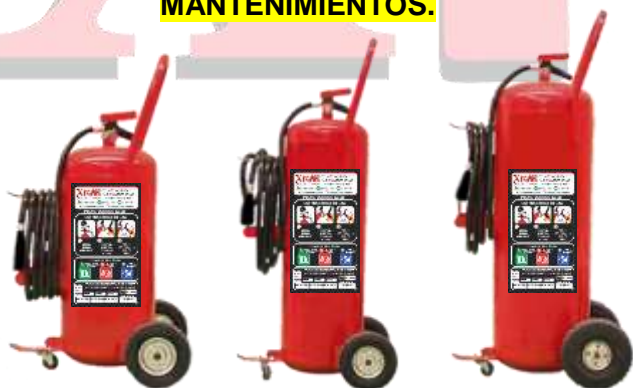
UNIDAD MOVIL DE POLVO QUÍMICO SECO 35 KG, 50 KG Y 50 KG. NUEVOS, RECARGAS Y MANTENIMIENTOS.