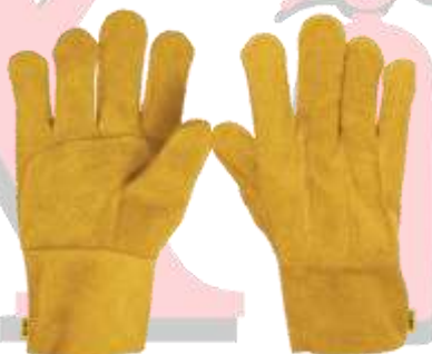
GUANTE DE CARNAZA CORTO AMARILLO