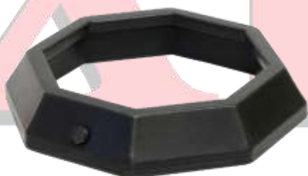
BASE PARA TRAFITAMBO