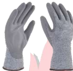
GUANTE ANTICORTE NIVEL 5 #7, #8, #9