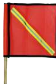
BANDEROLA DE MALLA

Quebrada No. 23, Col. Lomas de San Andrés Atenco Ampliación C.P. 54040, Tlalnepantla de Baz, Estado de México