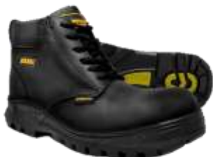
ZAPATO DE SEGURIDAD SUELA DE COLORES DIELECTRICO