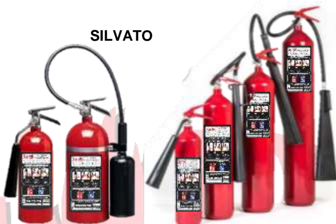
EXTINTOR DE CO2 DE 2.3 KG, 4.5 KG, 6.0 KG Y 9.0 KG. NUEVO, RECARGA Y MANTENIMIENTOS.