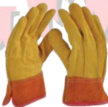
GUANTE DE PIEL DE CERDO