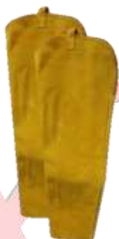
MANGA DE CARNAZA