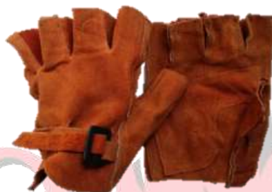
GUANTALETA DE CARNAZA