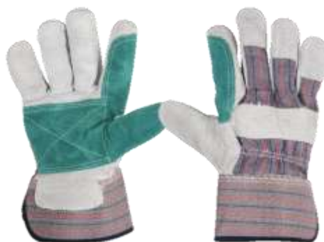
GUANTE DE CARNAZA TIPO MUSTANG