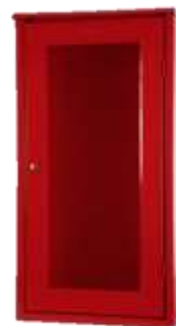
GABINETE PARA EXTINTOR DE PARED