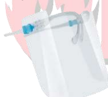
CARETA FACIAL SENCILLA CON LENTE