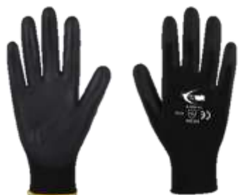
GUANTE NYLON CON POLIURETANO #7, #8, #9