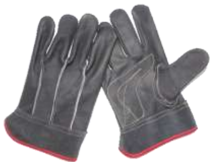
GUANTE DE PIEL VESTIMENTA