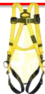
ARNES SENCILLO 3 ANILLOS