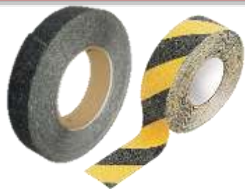
CINTA ANTIDERRAPANTE 2", 4", 6"