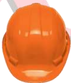
CASCO DE SEGURIDAD INTERVALOS