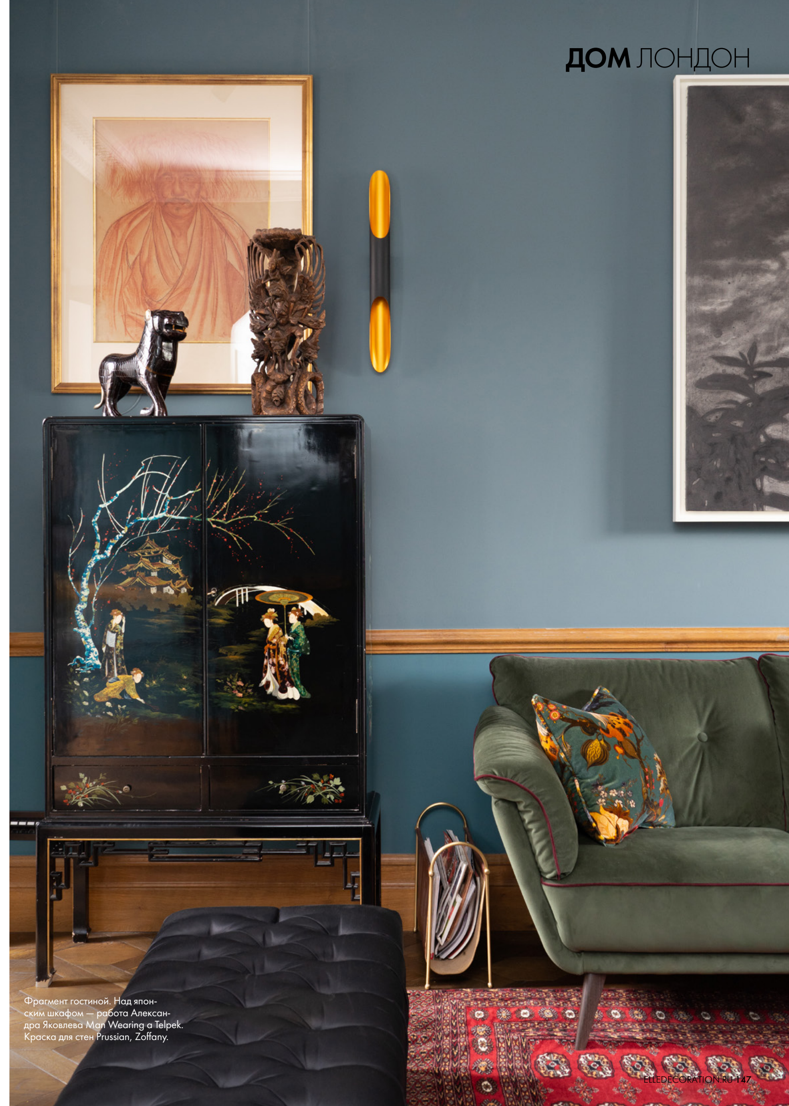
Фрагмент гостиной. Над японским шкафом — работа Александра Яковлева Man Wearing a Telpek . Краска для стен Prussian, Zoffany.