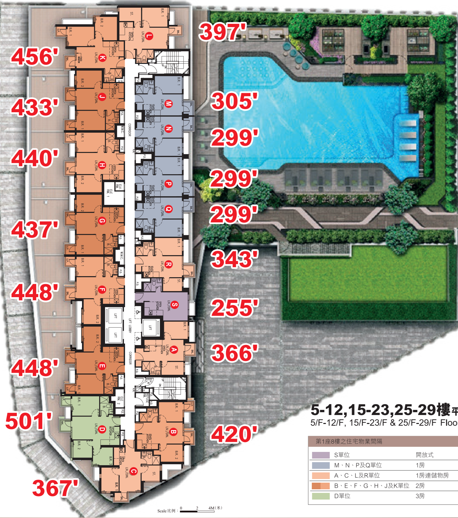
5-12,15-23,25-29樓平面圖 5/F-12/F, 15/F-23/F & 25/F-29/F Floor Plan