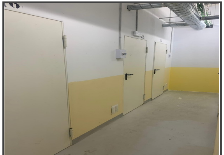
Pasillos , frente de trasteros a estrenar