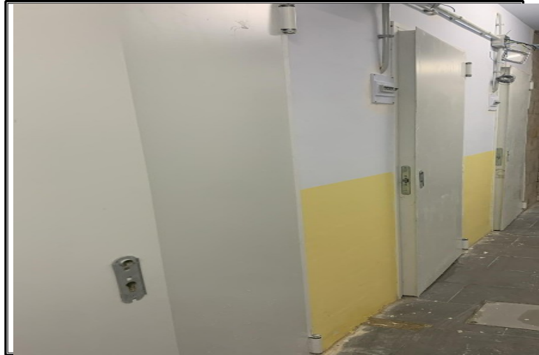
Pasillo , y puertas de entidades