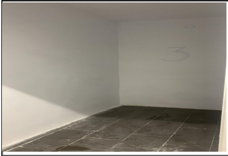
Interior de la entidad