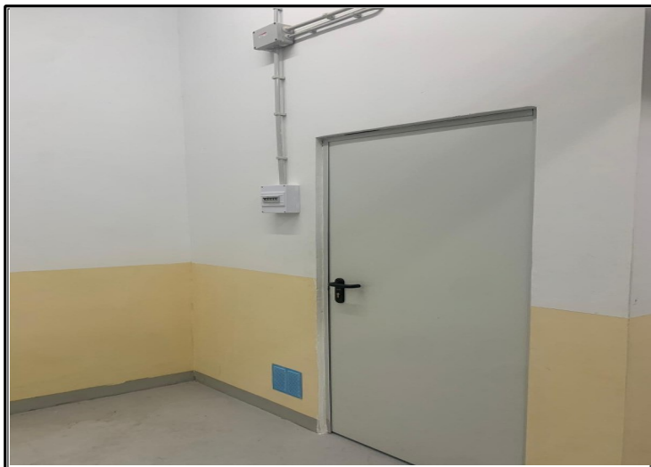
Vista exterior sub-entidad y medidor de luz independiente