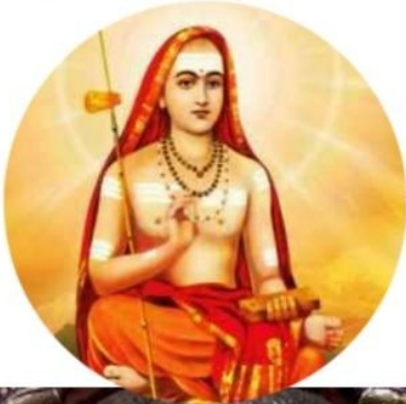
- RadheKrishna -