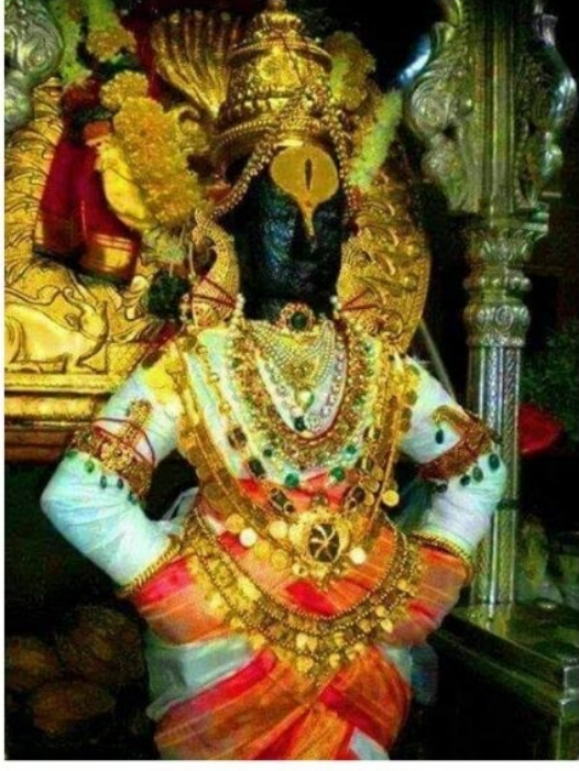
- RadheKrishna -