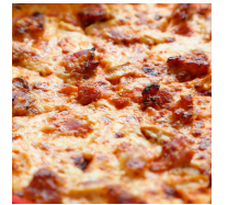
La bacon oignons