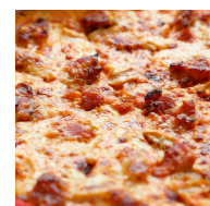
La bacon oignons