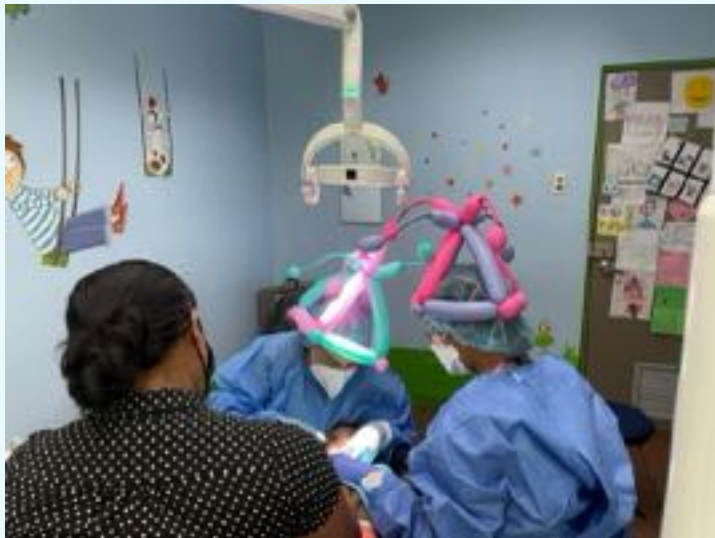
Externado Clínica Marcial Fallas Diaz