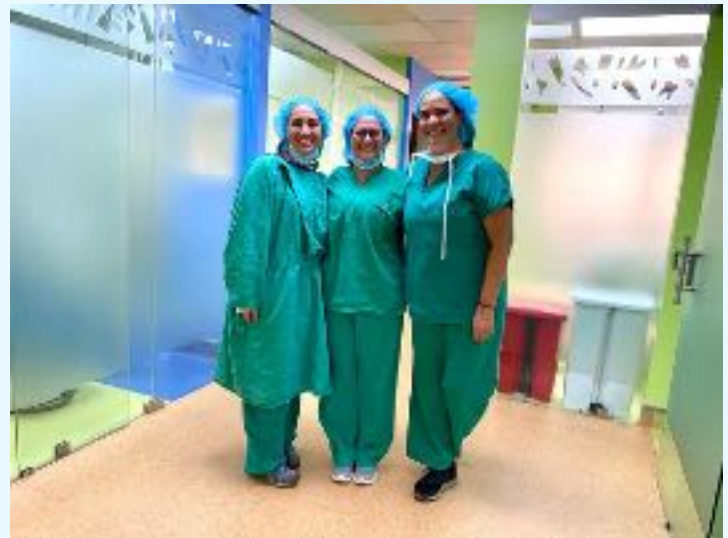
Rotación Hospital Nacional de Niños