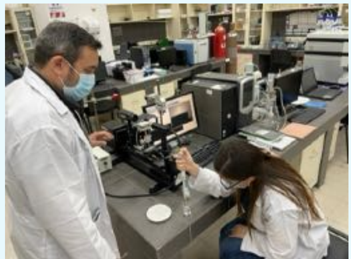
Centros de Investigación