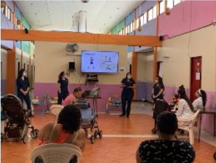
Actividades de educación con madres de casa cuna en Centro de Atención Institucional Vilma Curling – Centro Penitenciario Buen Pastor