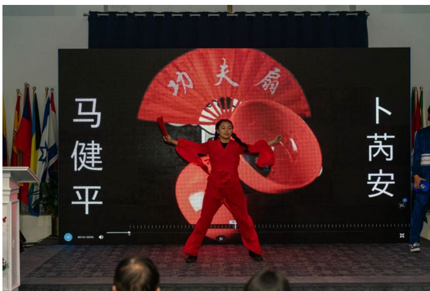
米德高中芮安的功夫扇表演