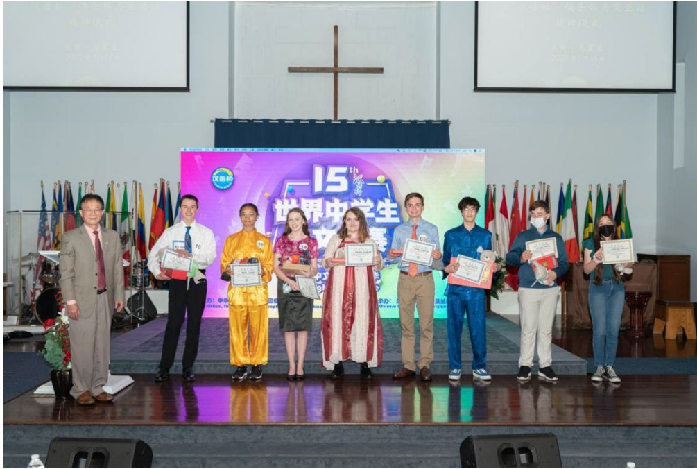
高中组线下汉语桥获奖选手颁奖典礼

“汉语桥”俱乐部马里兰站为了为了环节比赛的紧张气氛，组委会增设了中华美食午餐体验环节，让参赛选手们、不同学校的老师们、评委们可以通过午餐相互交流汉语和汉文化，增进感情，增加汉语学习乐趣。在保持安全的社交距离下，食堂设置了圆形和长形桌，方便大家交。美食包括中国面食、南北方特色菜和相应甜点、水果，汤水作为辅菜。