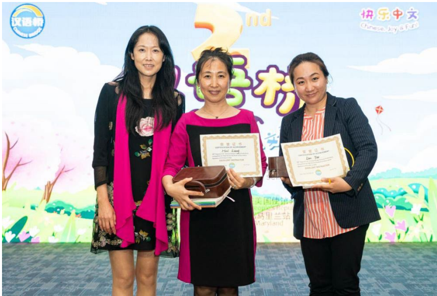
高中组优秀指导教师获奖