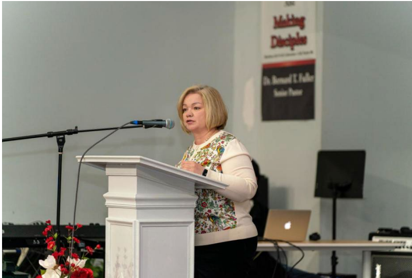
巴尔的摩国际学校校长致辞