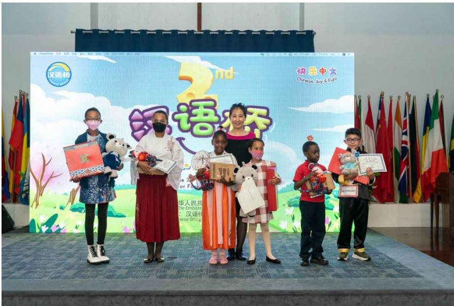
线下比赛小学生组与获奖选手颁奖合影留念。

2022 年线上汉语桥比赛收到了前所未有的报名量，其中第 21 届大学生汉语桥比赛共 12 人参加，分别来自 7 个州 (Alabama, Georgia, Idaho, Illinois, Kentucky, Texas, Utah, Virginia) 的 7 所大学，大学生选手们仅仅围绕着“天下一家”的主题展开深入演讲，用词丰