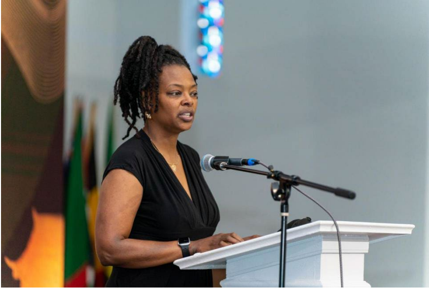
华盛顿育英公立特许学校校长致辞

美东时间 2022 年 5 月 14 日，马里兰汉语桥俱乐部举办了美东赛区的实体两场线下针对高中生和 Kindergarten 到 8 年级组别的汉语桥比赛。美东上午 8 点，很多参赛者以及参与助阵的家长们，指导教师们早早来到比赛会场，根据比赛流程参与消毒、测量体温、出示疫苗卡进如签到环节。选手们抽签后依次进入会场后就进入了正式的比赛环节，顺序靠前的参赛选手们摩拳擦掌，跃跃欲试准备一展身手；顺序靠后的选手们则相对轻松一些，留有跟多时间准备。