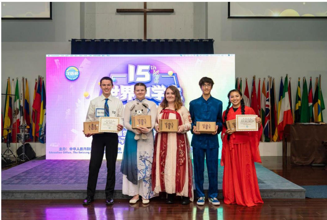
高中组线下汉语桥最佳才艺奖和最佳组织奖获奖选手颁奖