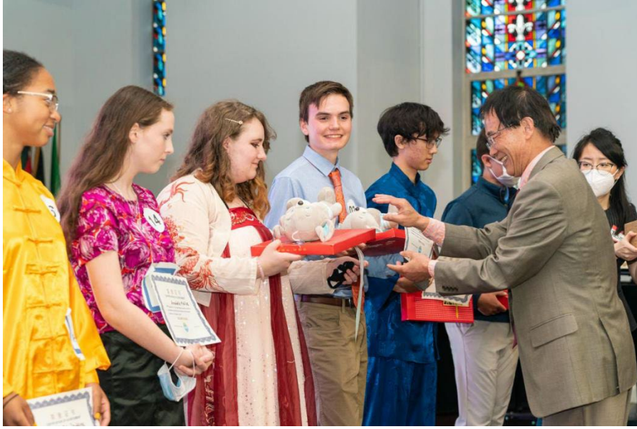
高中组获奖选手颁发证书、奖品