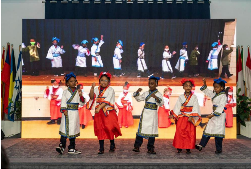
巴尔的摩国际学校参赛选手表演《吉娃娃》