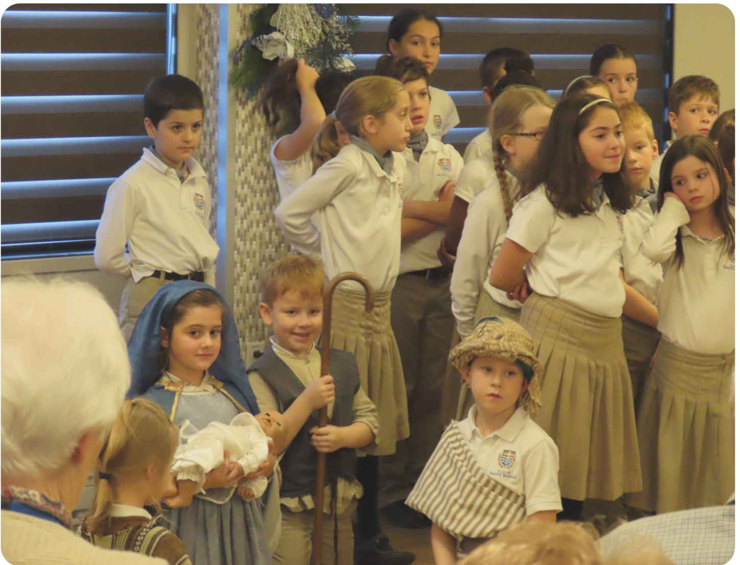
Nos élèves du primaire présentent le concert de Noël dans une résidence pour personnes âgées

L'école Sainte-Famille vous souhaite un joyeux et saint Noël