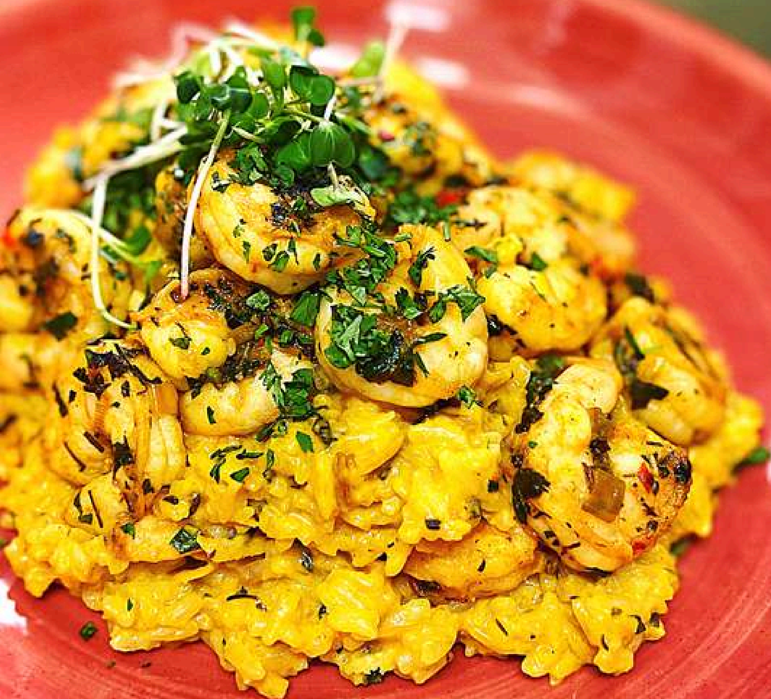
Arroz Meloso de Camarones