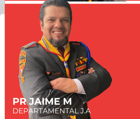
PR JAIME M. DEPARTAMENTAL J.A