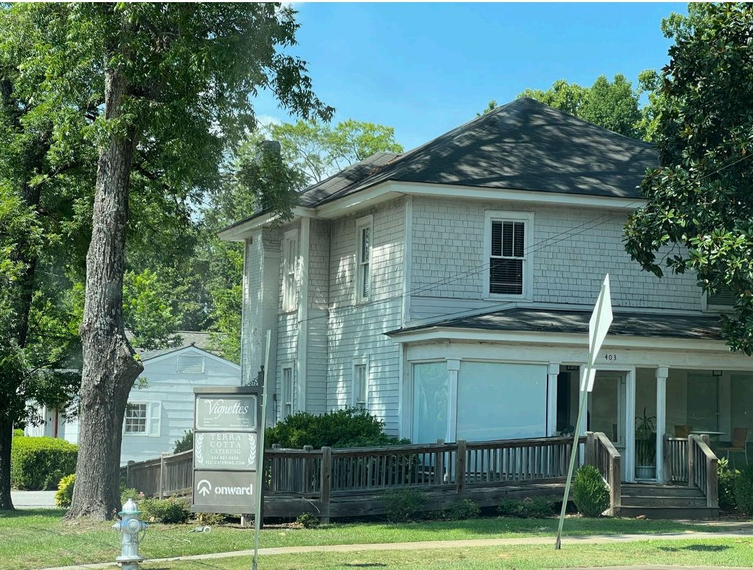
Baptist Campus Ministries (2014–2016)