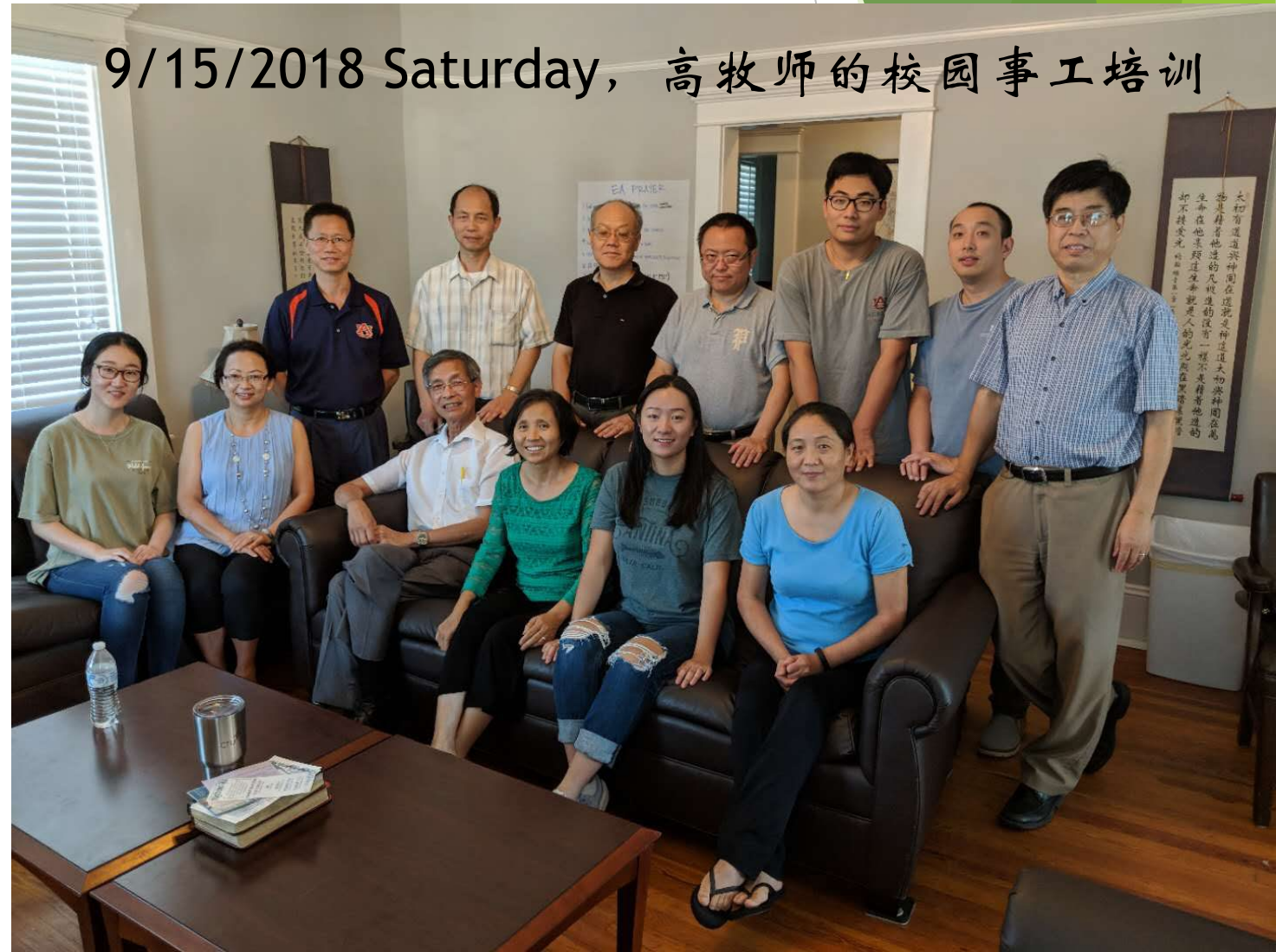
9/15/2018 Saturday, 高牧师的校园事工培训