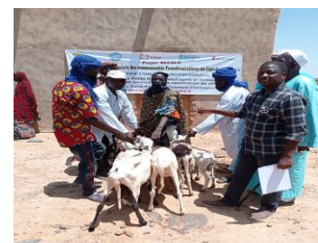
Figure 3 Remise de têtes petits ruminants à une bénéficiaire