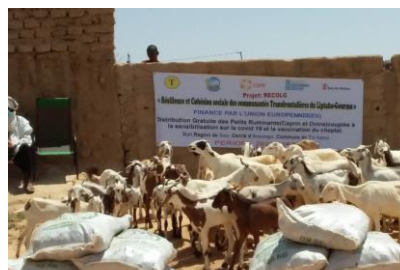
Figure 4 Reconstitution des cheptels dans les communes pastorales et agropastorales région de Gao