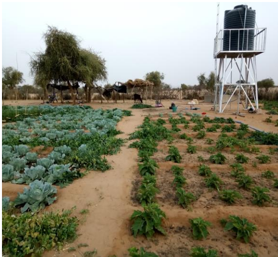
Figure 1 appui des actifs communautaires région de Gao