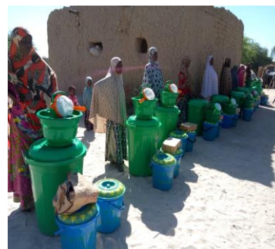
Figure 6 réponse Covid 19

☞ Santé : La crise sanitaire mondiale causée par l'épidémie de la Covid-19 a eu des effets négatifs sur les revenus des communautés. En vue de stopper la propagation de la pandémie TASSAGHT à travers les projets Covid 19 a procédé à des distributions de kits sanitaires combinées à des séances de sensibilisation sur les mesures barrières et les attitudes comportementales en cas de suspect.