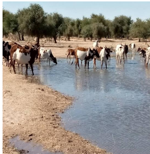
Figure 2 suivi des mouvements des bétails région de Mopti