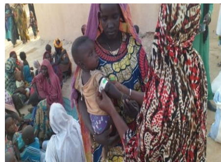
Figure 5 Dépistage réalisé par le GSAN mis en