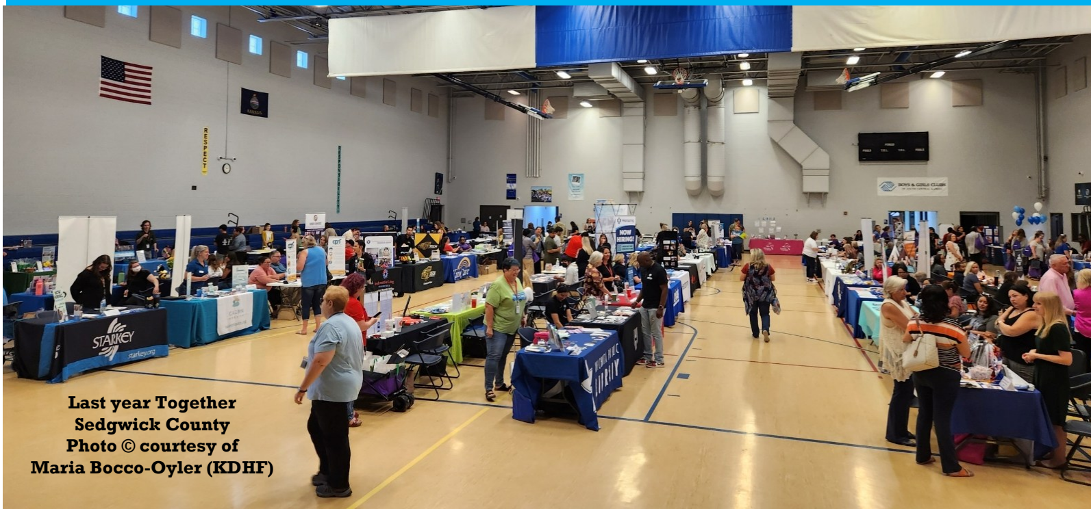
Last year Together Sedgwick County

So, do not miss this annual event and remember to visit El Perico Informador, LLC table, to get your free subscription, some swag, and past copies of El Perico Informador. See you there!