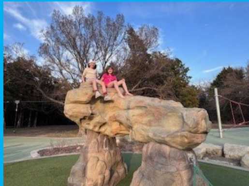
Grandkids playing at the playground! Nietos jugando en el patio de juegos!

As spring blossoms with fresh opportunities, it's the perfect season to step away from screens and embrace quality time with loved ones. In today's fast-paced, technology-driven world, getting lost in digital distractions is easy. However, creating intentional screen-free moments can strengthen relationships, improve mental well-being, and create lasting memories. Families can cultivate deeper connections and rediscover the joy of unplugged living by making small, mindful changes.