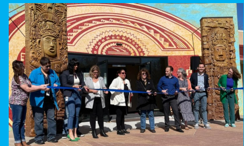
Evergreen Community Center & Library. Centro Comunitario y Biblioteca Evergreen