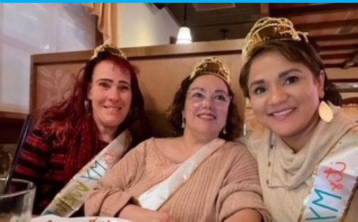
An excuse to go out with friends celebrating belated birthdays!

Una excusa para salir con las amigas, celebrando un cumpleaños tarde!