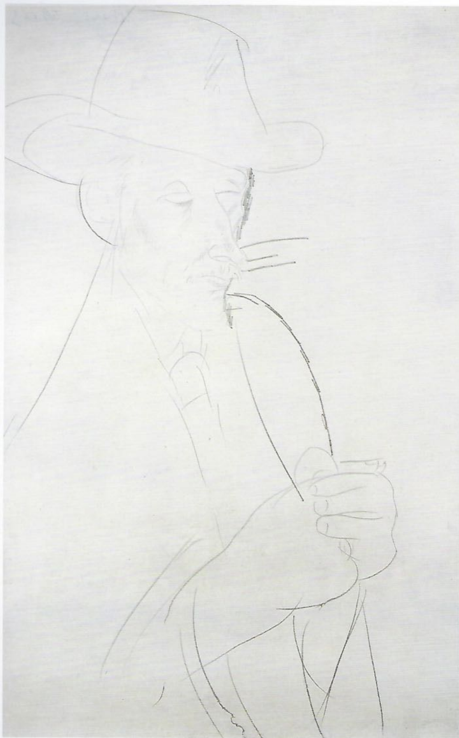
Tav. 23 Il caballero s.d. Matita su carta, 422 × 260 mm Collezione privata