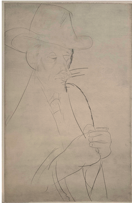
Amedeo Modigliani Caballero c.1916 Lead pencil on paper 42.2 x 26 cm Unsigned