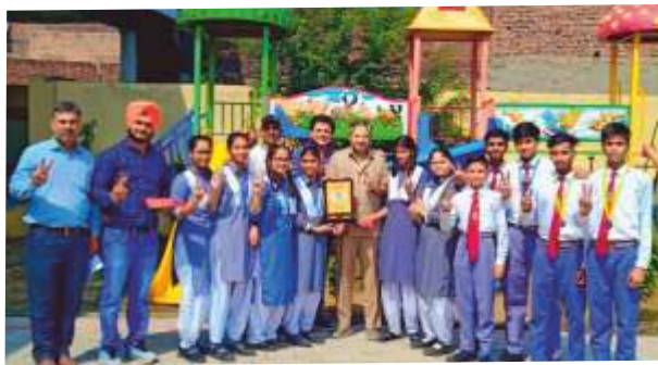
TROPHY IN JUDO