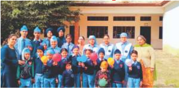
ਬਾਲ ਦਿਵਸ ਅਤੇ ਹਰ ਦਿਨ ਤਿਉਹਾਰਾਂ ਦੀ ਜਾਨਕਾਰੀ