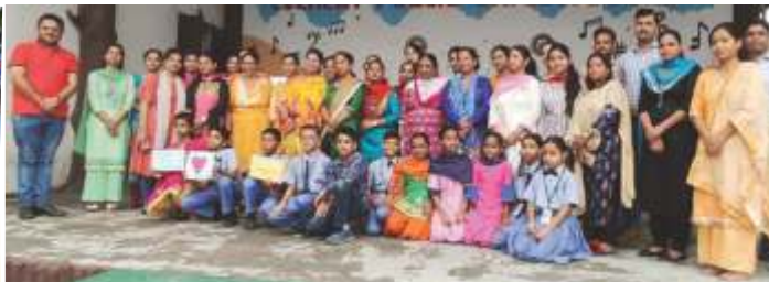
OUR TEACHERS & MONITORS