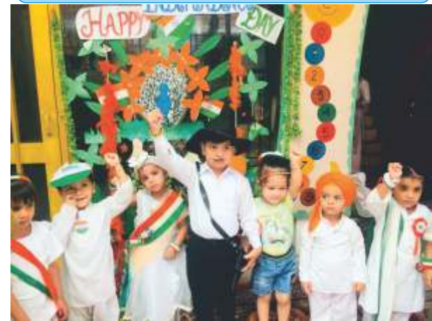
INDEPENDENCE DAY CELEBRATIONS