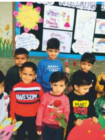
CHILDREN DAY CELEBRATIONS