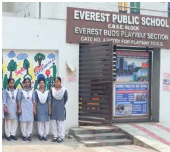
Playway Inside Moti Nagar Campus