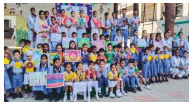
GREEN DIWALI CELEBRATIONS