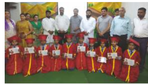
ਰਿਸ਼ਤਿਆਂ ਦੀ ਕੀਮਤ ਸਮਝਾਂਦਾ - ਗਰੈਂਡ ਪੇਰੈਂਟਸ ਦਿਹਾੜਾ