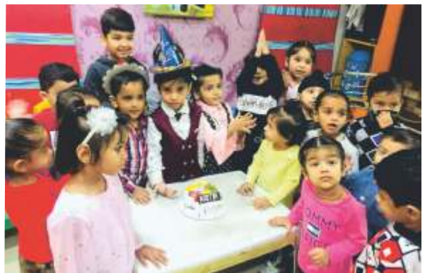
BIRTHDAY CELEBRATION FOR KIDS