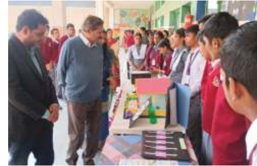
SCIENCE FAIR AT SCHOOL