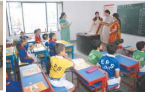
Class Room Junior