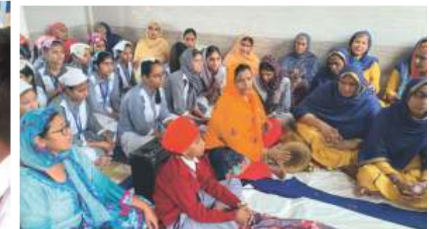
SUKHMANI SAHIB KIRTAN