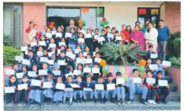
SCIENCE FAIR WINNERS