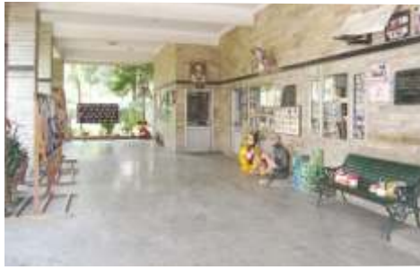
Administration Block, Moti Nagar