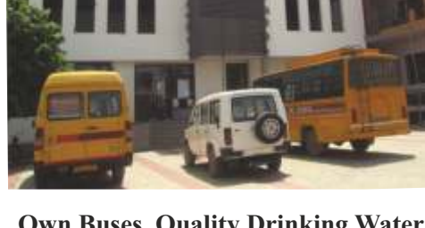
Own Buses, Quality Drinking Water & Soon coming solar Lighting