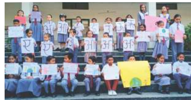
HINDI DIWAS CELEBRATION