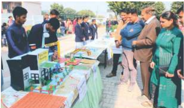
SCIENCE FAIR GLIMPSE