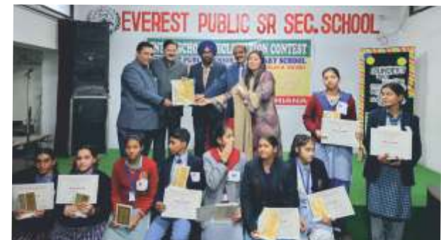
DECLAMATION CONTEST WINNERS