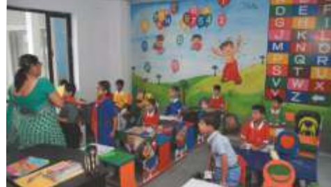
Class Room Playway