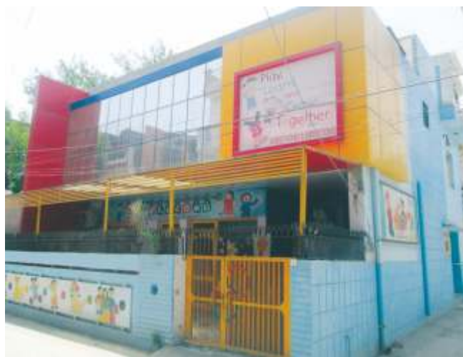
Outside view of Ranjit Park Playway