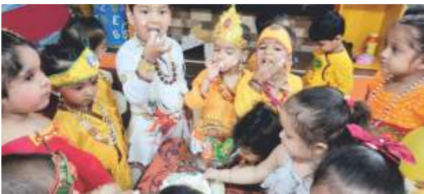
'MAKHAN' FEAST AT JANAM ASHTAMI