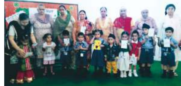
ਰਿਸ਼ਤਿਆਂ ਦੀ ਕੀਮਤ ਸਮਝਾਂਦਾ - ਗਰੈਂਡ ਪੇਰੈਂਟਸ ਦਿਹਾੜਾ