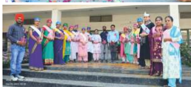
TEACHERS DAY HONOURS