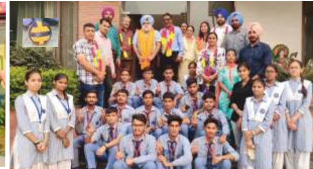
TROPHY IN VOLLEYBALL