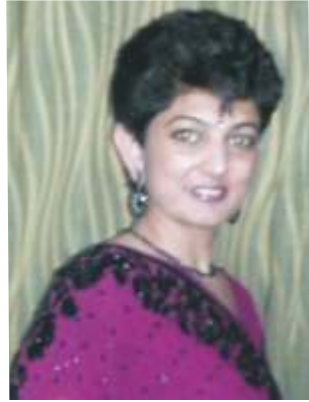
Mrs. Vandana Playway Co-ordinator

E verest aims at strengthening the moral and spiritual values of children.