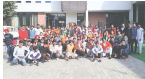
ਫਿਅਰਵੈਲ ਮੌਕੇ ਦੀ ਇੱਕ ਝਲਕੀ