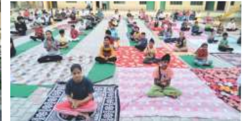
YOGA CLASS AT SUMMER CAMP