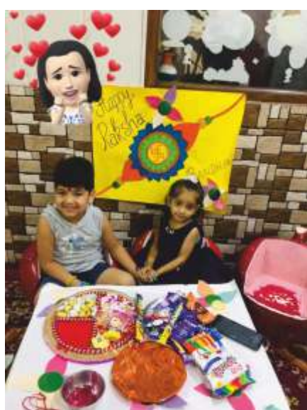
THE IMPORTANCE OF RAKHI