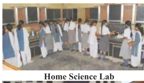
Home Science Lab