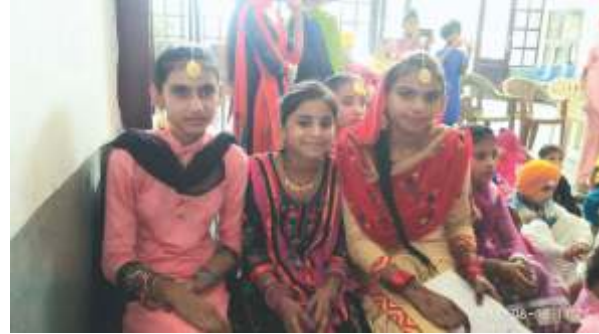
ਤੀਜ ਦੇ ਮੌਕੇ ਤੇ ਤਿਆਰ ਵਿੱਧਿਆਰਥਨਾਂ