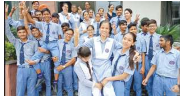
Academic Excellence - 100% Success Rate