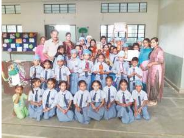
ਸਕੂਲ ਦਿਹਾੜੇ ਦੌਰਾਨ ਇਨਾਮ ਜਿੱਤਣ ਵਾਲੇ ਵਿਦਿਆਰਥੀ