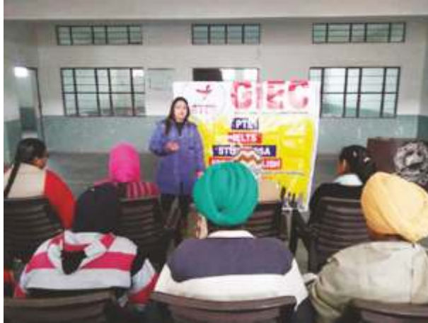
STUDY VISA ਰਾਹੀਂ ਵਿਦੇਸ਼ ਜਾਣ ਦੀ ਜਾਨਕਾਰੀ ਲੈਂਦੇ ਵਿਦਿਆਰਥੀ