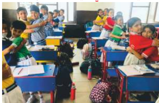
ਈਦ ਦੇ ਮੌਕੇ ਤੇ ਪਿਆਰ ਦਾ ਸੁਨੇਹਾ ਦਿੰਦੇ ਵਿੱਧਿਆਰਥੀ