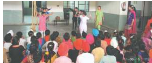
ਇੱਕ ਨਾਟਕੀ ਝਲਕੀ ਪੇਸ਼ ਕਰਦੇ ਵਿੱਦਿਆਰਥੀ