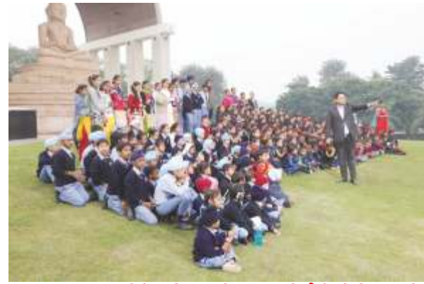
ਸਕੂਲ TOUR ਵੇਲੇ ਦੁਨਿਆ ਦੀ ਜਾਨਕਾਰੀ ਲੈਂਦੇ ਵਿਦਿਆਰਥੀ