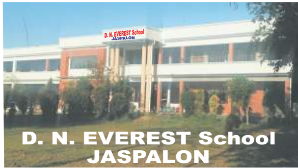
D. N. EVEREST School JASPALON