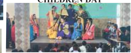
STAGE SHOW DURING 'TEEJ'