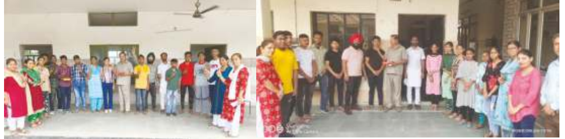
100% RESULT OF CLASS 10

विद्यालय के सभी अध्यापकगण सुयोग्य तथा विद्यार्थियों के प्रति प्रेम तथा सौहार्द भाव रखने वाले हैं। अच्छे परीक्षा परिणाम तथा विद्यालय में सदा रहने वाला खुशी का माहौल हमारे शिक्षकों