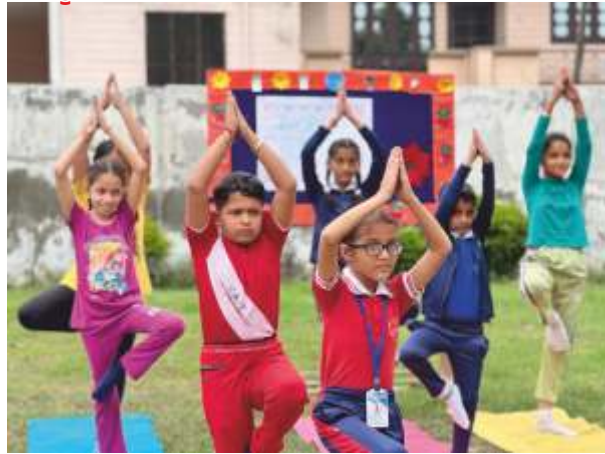
ਪੜ੍ਹਾਈ ਦੇ ਨਾਲ ਸ਼ਰੀਰਿਕ ਤੰਦਰੁਸਤੀ ਦੀ ਦੇਖਭਾਲ