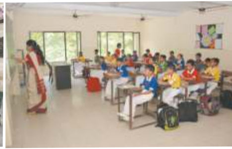
Class Room Senior