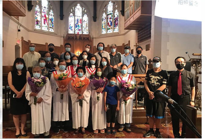
福音聚会 - 小组献诗