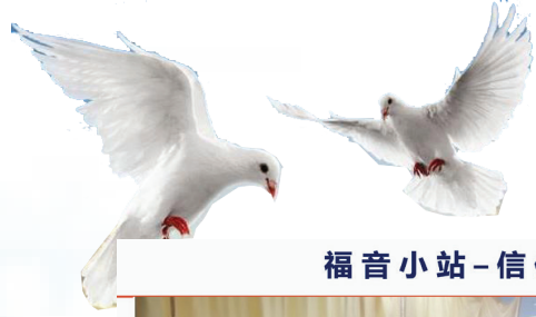
福音小站-信仰讨论