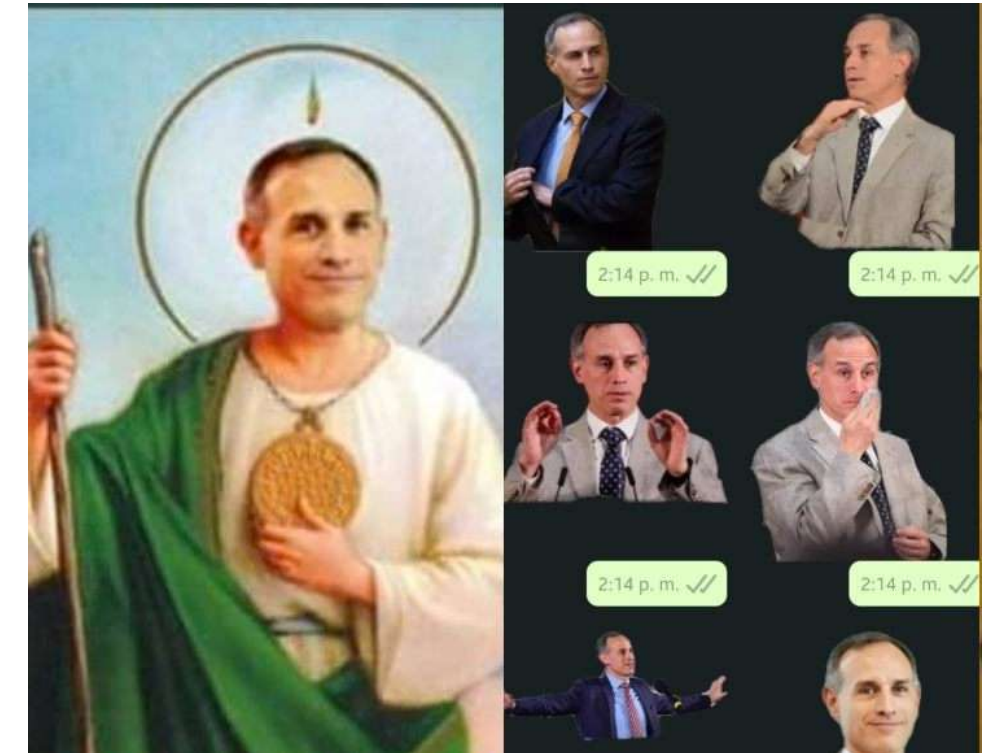
López Gatell viendo en mis stories cómo me quedo en casa

y traten de no hacerle caso, o al menos, no del todo a TV Azteca.