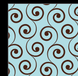
GRAFICA VINTAGE - OPTIONAL

Si precisa che le tonalità dei colori qui riprodotti potrebbero non corrispondere fedelmente alla realtà, per motivi dipendenti dai limiti connessi alle tecniche di stampa su carta.