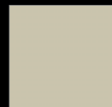
RAL 7044 - OPTIONAL