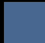
RAL 5023 - OPTIONAL