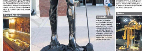
El área de Tutankamón.