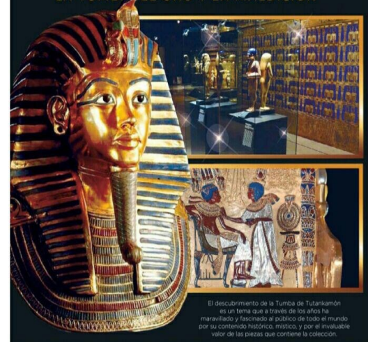
El descubrimiento de la Tumba de Tutankamón es un tema que a través de los años ha maravillado y fascinado al público de todo el mundo por su contenido histórico, místico, y por el invaluable valor de las piezas que contiene la colección.