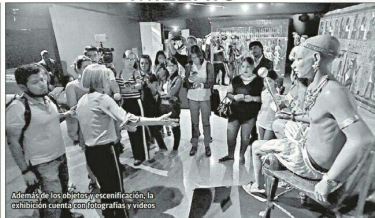
Asamblea de los objetos presentados en la exhibición en la sede de la muestra en BPEJJ.

Cultura MILENIO Miércoles 21 de marzo de 2018 • 31