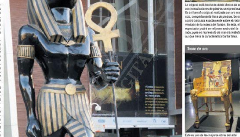
En uno de los módulos de la muestra se exhiben réplicas de los objetos más importantes de la tumba de Tutankamón.

El tesoro del faraón egipcio ha sido el objeto de fascinación y admiración desde su descubrimiento en 1922. Este tesoro, que se conserva en el Museo Egipcio de El Cairo, es el más rico y completo de la historia. En esta exposición se muestran 10 de los objetos más importantes de la tumba de Tutankamón, desde el cofre de oro hasta el sarcófago de oro. La exposición se divide en tres secciones: "La tumba", "El tesoro" y "La maldición".