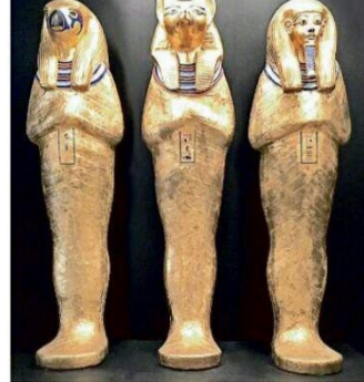
De las 200 piezas que se exhibirán en esta muestra en Guadalajara, 170 son réplicas y 30 son originales.