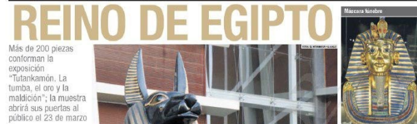
Más de 200 piezas conforman la exposición "Tutankamón. La tumba, el oro y la maldición"; la muestra abrirá sus puertas al público el 23 de marzo

El tesoro del faraón egipcio ha sido el objeto de fascinación y admiración desde su descubrimiento en 1922. Este tesoro, que se conserva en el Museo Egipcio de El Cairo, es el más rico y completo de la historia. En esta exposición se muestran 10 de los objetos más importantes de la tumba de Tutankamón, desde el cofre de oro hasta el sarcófago de oro. La exposición se divide en tres secciones: "La tumba", "El tesoro" y "La maldición".