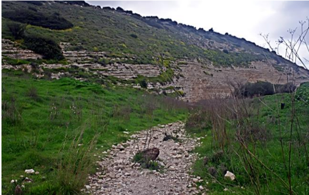
El arroyo seco en el valle de Ela del que David recogió sus cinco piedras.

Cuando David entró al campo, Goliat lo despreció. David puso una piedra en su honda y se la arrojó a Goliat, golpeándolo en la frente. Goliat cayó al suelo. David corrió hacia Goliat y, usando la espada de él, le cortó la cabeza. ¡La victoria se había ganado!