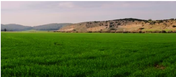
El ejército de Israel estaba en la colina que se ve en la foto.