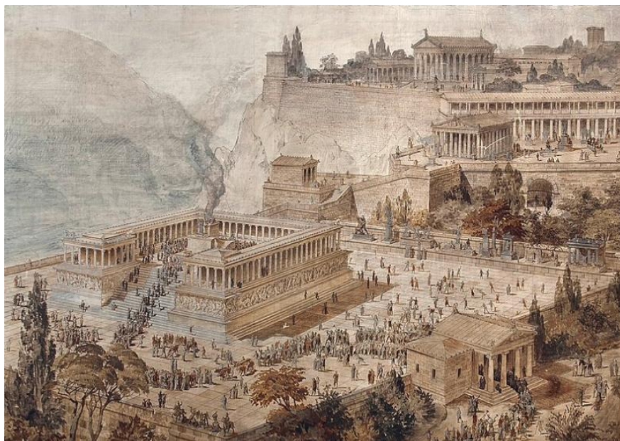
Pérgamo en los tiempos antiguos

Los mensajes del Señor Jesús a las siete iglesias de Asia brindan información valiosa acerca de la perspectiva divina de la Iglesia como Su cuerpo y los peligros que enfrenta cada miembro. Es importante recordar que no sólo están dirigidos a los cristianos de esa época, sino que son para todo aquel que tenga oídos para oír (Marcos 4:9).