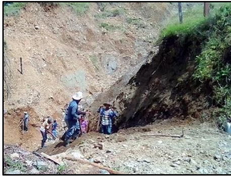
Preparación del camino en La Virtud.

Entre los preparativos se ha arreglado el camino para el transporte del material además de alistar el plantel donde se construirán las casas.