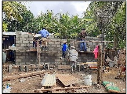
Construcción en Aldea Urraco.