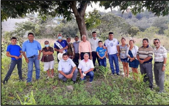
Fotografía en el terreno comprado.

24. Asociación De Salas Evangélicas De Honduras: El 15 de enero se compró un terreno de 6 lotes ubicados en La Entrada, Copán, para 6 familias de aldea La Reina que sufrieron pérdida de sus hogares en los huracanes Eta e Iota. La compra se realizó mediante donaciones del exterior de una institución llamada Coordinadora de Iglesias en España, canalizada a través de la Asociación de Salas Evangélicas de Honduras.