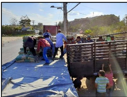
Transporte del material.

Damos la honra y la gloria a nuestro Señor Jesucristo quien ha provisto de manera SUFICIENTE Y SOBREABUNDANTE.