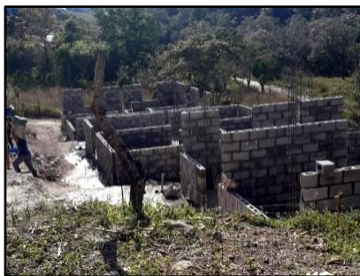
Avance de 3 de las 7 casas.