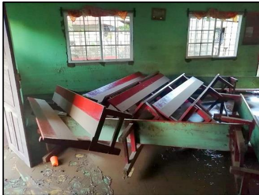
Daños en la capilla debido a las inundaciones.

Solicitamos sus oraciones ya que estamos realizando ventas de comida una vez al mes, para recaudar fondos para la reparación del edificio, que sufrió daños por las inundaciones.