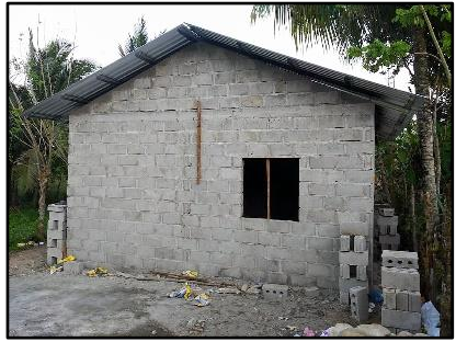
Construcción de la casa del hermano Eduardo, iniciada y terminada.

En la aldea Urraco, El Progreso se dio inicio también al trabajo de construcción de 4 casas de hermanos.