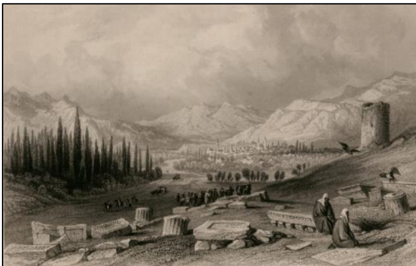
Las Ruinas de Tiatira

De los mensajes que Jesús envió a las siete iglesias, el mensaje a la iglesia en Tiatira es el más largo. Es posible que esto fuera porque, escondido bajo el floreciente crecimiento espiritual, existía un grave peligro que amenazaba, no solo el testimonio de la iglesia, sino su mera existencia. La advertencia que Jesús les envía sobre dicho riesgo no se limita a quienes vivían en aquella época, sino que trasciende hasta nosotros.