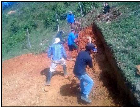
Preparación del plantel en La Virtud.