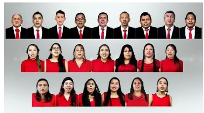
Coro de Bo. El Benque.

También tuvimos la participación de varios coros de diferentes asambleas del país. El evento fue compartido y visto por hermanos de diferentes partes de nuestro país, así como en los países de: España, Estados Unidos, Guatemala, Costa Rica, México, El Salvador, Nicaragua, entre otros.