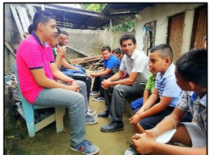
Clase dominical el 3 de enero.