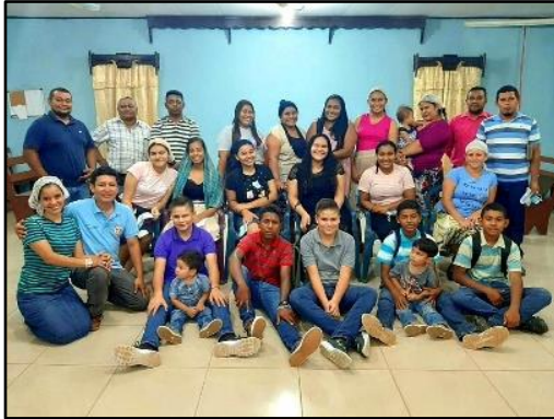
Estudio bíblico juvenil.