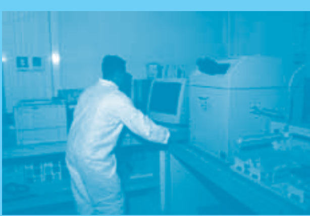
Equipo ICP-MS, para análisis de residuos de disparo

El oficio debe contener la solicitud expresa del análisis requerido, la unidad de Fiscalía, o la autoridad de policía judicial solicitante, dirección y teléfono. Así mismo, debe registrarse la autoridad con los datos correspondientes para el envío del dictamen o informe del laboratorio