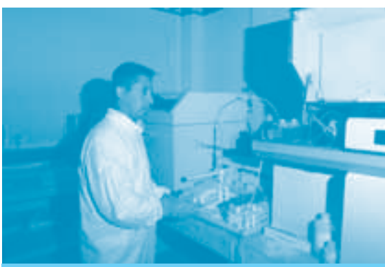
Análisis de residuos de disparo en mano por ICP-MS

deben preservarse libres de cualquier tipo de contaminación en especial la relacionada con metales.