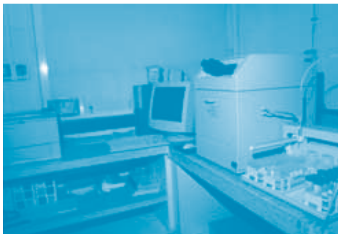
Espectrómetro de masas acoplado a plasma inducido de Argón

Todo el material utilizado anteriormente se relaciona y almacena en la bolsa plástica con cierre tipo cremallera se ROTULA Y SELLA de acuerdo con la Resolución 0-1890 del 5 de noviembre de 2002 que establece el diseño y aplicación del sistema de cadena de custodia.