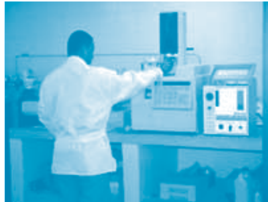
Cromatógrafo de gases

Calle 38 No 44-71. Piso 12. Edificio Lara Bonilla. Barranquilla. Telefax 3511823 – 3491178 - 3491065