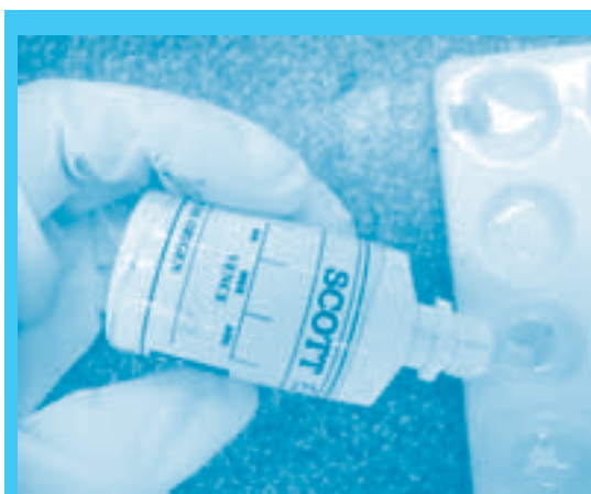
Los guantes protegen las manos de la acción de los reactivos

La manipulación de los reactivos para las pruebas preliminares, así sea en pequeñas cantidades, presenta riesgos para la salud, porque al entrar en contacto con las sustancias objeto de análisis o con el aire,