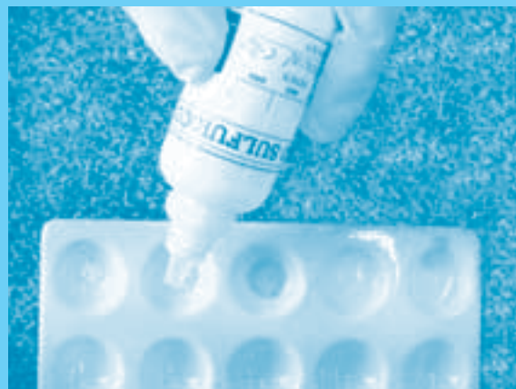
Aplicación de reactivo ácido sulfúrico en PIPH

La identificación preliminar de dichas sustancias es un proceso técnico en el que se utilizan reacciones químicas cualitativas, sencillas e inmediatas, basadas en el desarrollo del color y/o reacciones de precipitación. Esta identificación debe ser realizada por personal capacitado y certificado, dotado de los elementos de trabajo que requiere este tipo de pruebas en campo, cuyos resultados deben ser sin excepción confirmados por los laboratorios estatales reconocidos y competentes mediante el desarrollo de la prueba pericial, realizada por profesionales del área de química.