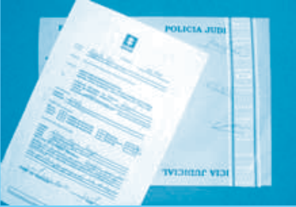
Describir en forma detallada el estado físico de las sustancias

4.2 Constatar la presencia de la Policía Judicial y del delegado del Ministerio Público y realizar la inspección ocular.