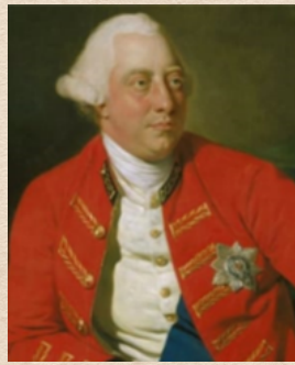
Rey Jorge III de Gran Bretaña