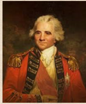
Sir Ralph Abercrombie Teniente General