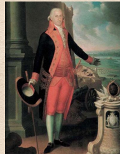
Ramón de Castro Gobernador de Puerto Rico