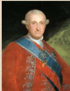
S. M Carlos IV