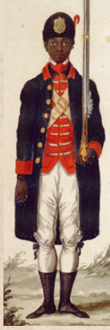
Infantero Compañía de Morenos