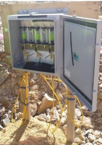
CELDA DE ASENTAMIENTO