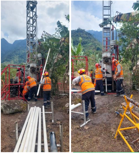
INSTALACIÓN y MONITOREO: PIEZOMETROS HIDRÁULICOS / CUERDA VIBRANTE