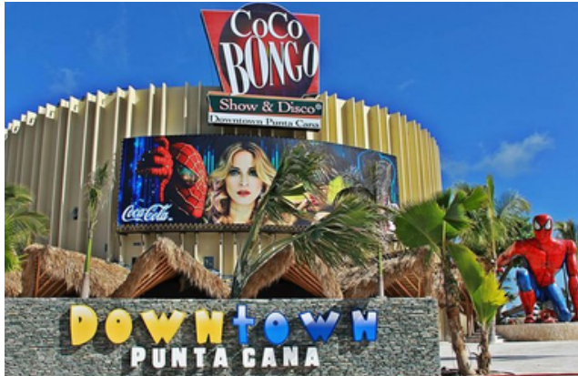
23min Coco Bongo