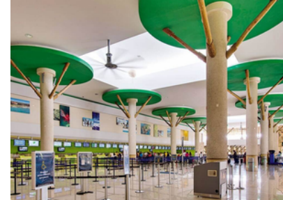
35min Aeropuerto Punta Cana