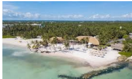
29min Cabeza de Toro - Pearl Beach