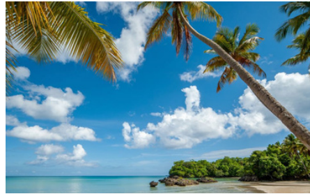
25 min El Cortecito