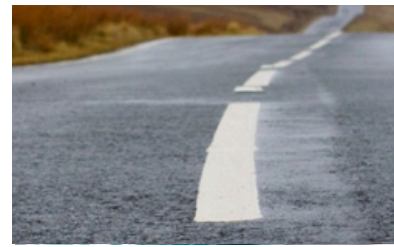
5 min Circunvalación Bavaro