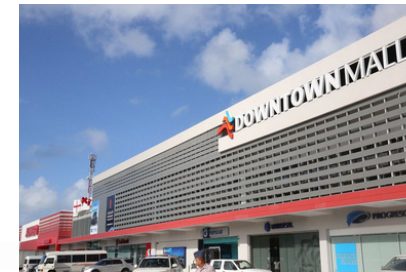
23min Downtown Mall