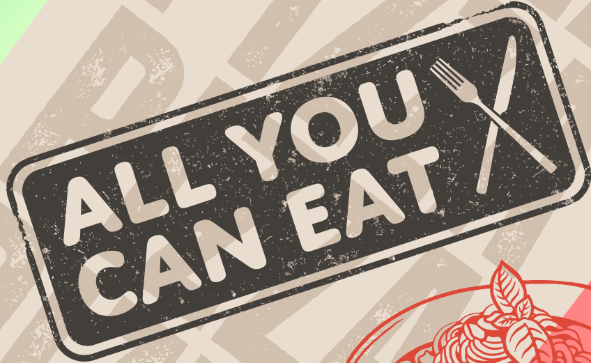
Spaghetti alla Bolognese