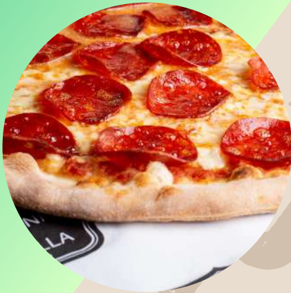
Pizza Personal Pepperoni